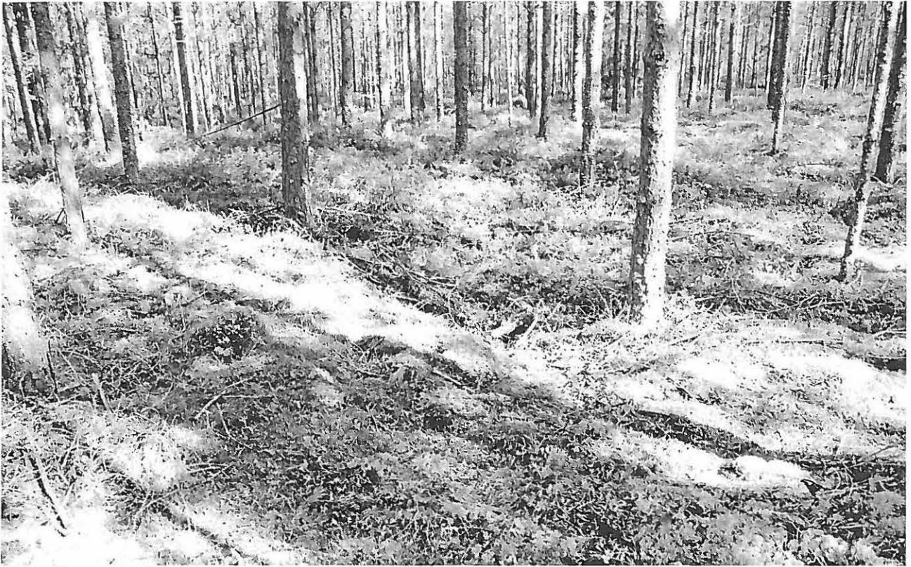
Mahdollinen pyyntikuoppa lähellä Byäsenin kivikautista asuinpaikkaa. Koillisesta.