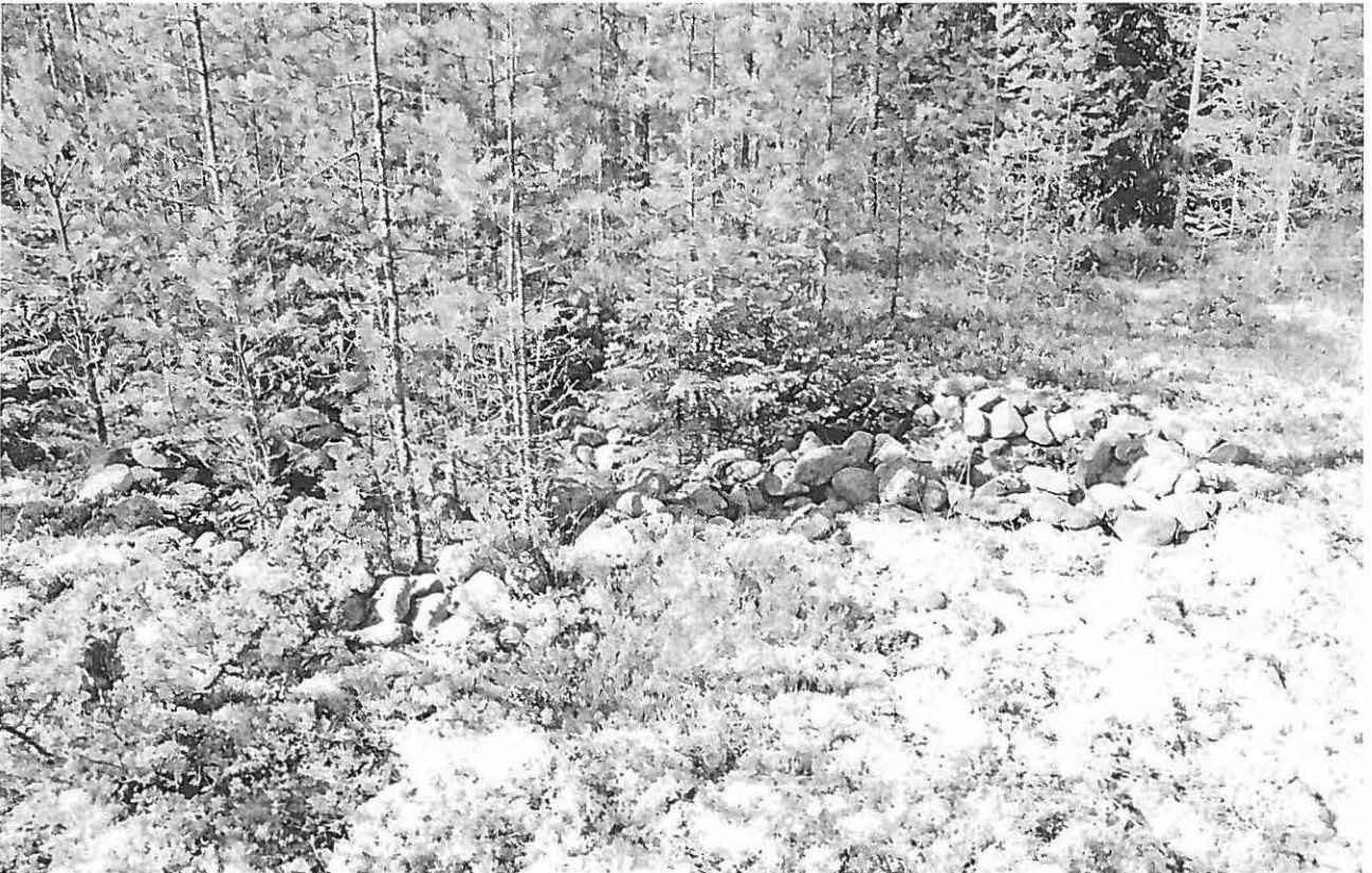
23 Pirunpellon pohjoisosa, johon rakennettu kivijonoista tiloja lähellä Byäsenin kivikautista asuinpaikkaa. Idästä.