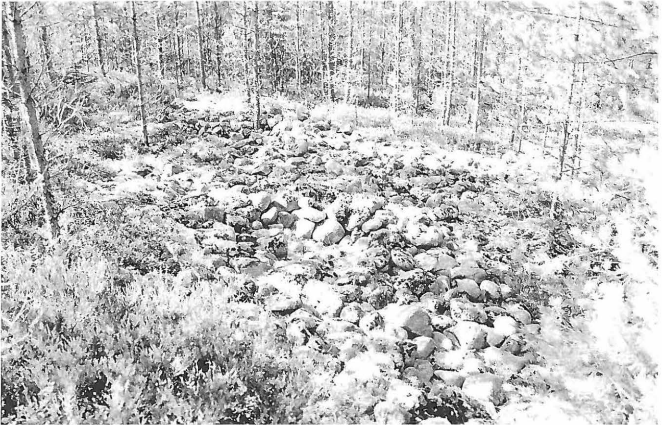
22 Pirunpelto, jossa kuoppia ja rakennelmia lähellä Byäsenin kivikautista asuinpaikkaa. Idästä. f.142678