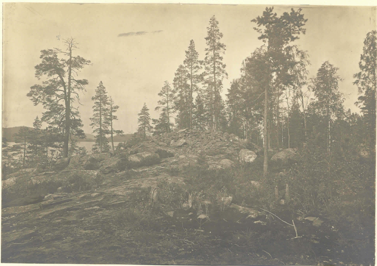
Jyväskylään pitäjässä. Lapinranta