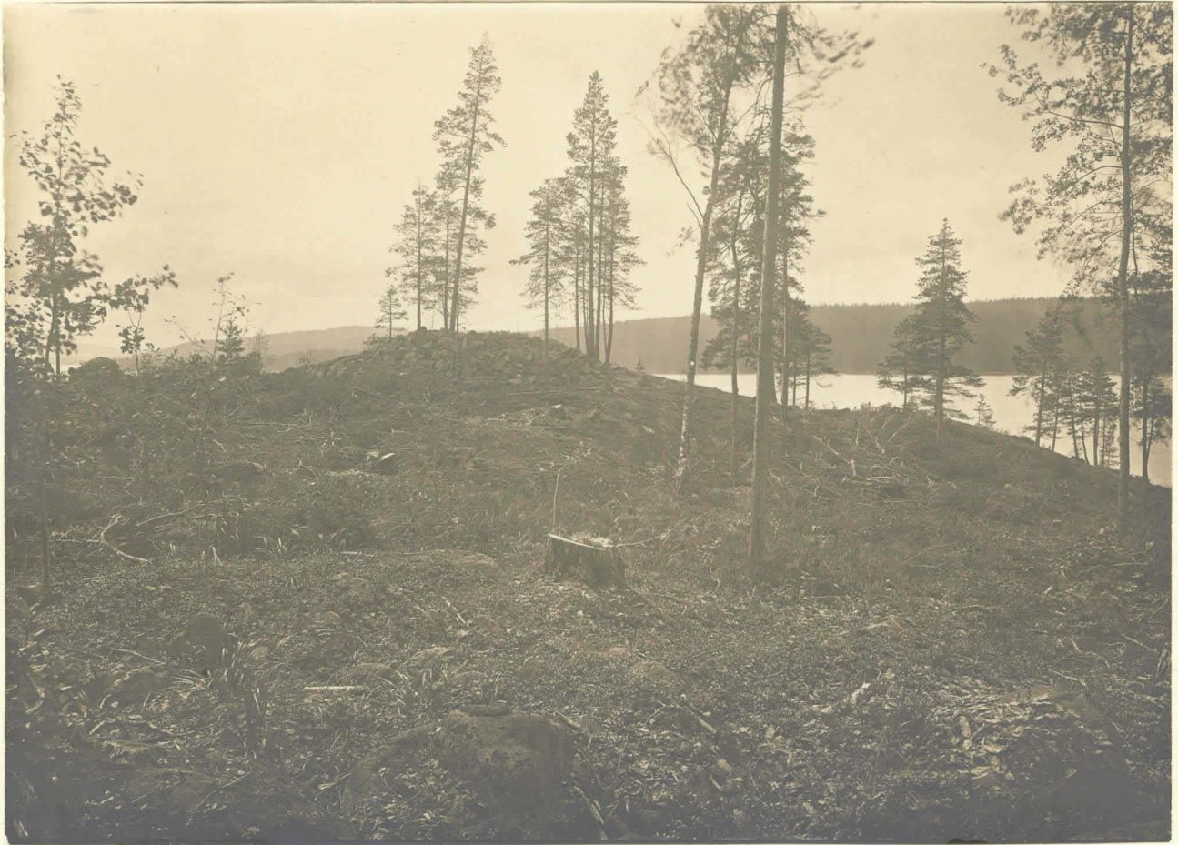
Jyväskylänsä pitäjässä. Lapinraunio