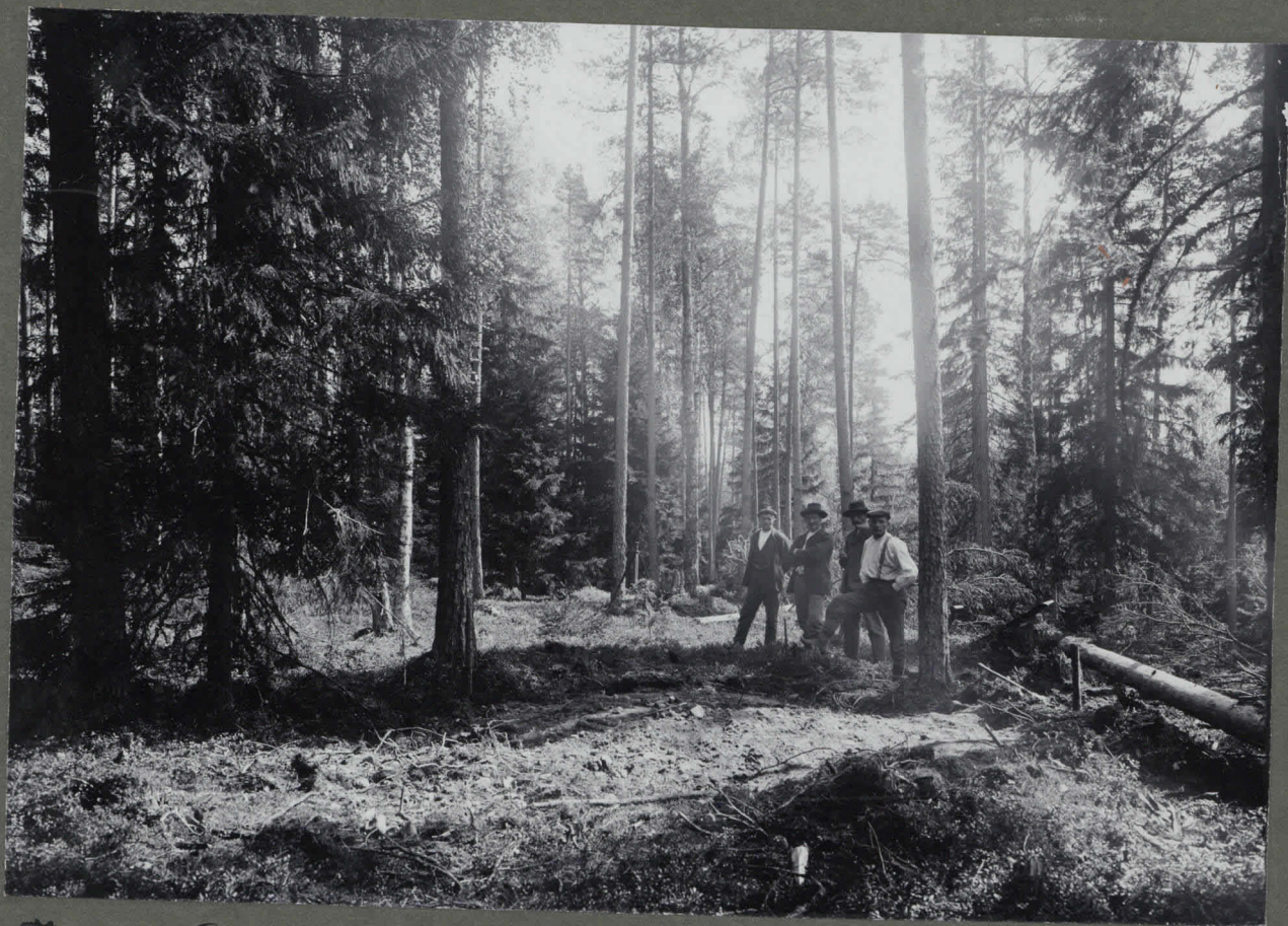
Jämijärvi, Vikhan kylä, Perämaäki 2783 Rantavihan talosta Jämijärven rannalta n. 1 km. S.E. suunnassa) heikko maakumpu, jonka päältä sammalpeite on poistettu, arveltu kivik. hautakymmyksi 1910 tullut L. L. Kes.