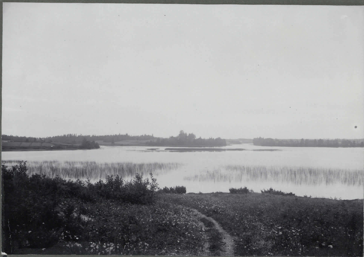
Sauvaniemen talo (Keskustasta) Jämijärven rannalla; oik. puolen saari, jonka vainiosta muuan kivi- esine löydetty (H. M. 5630). Talok. Lehtio kes 1910.