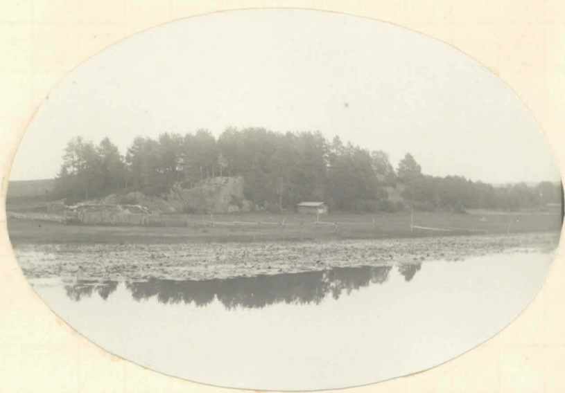
Pälämäki, sett från västern.