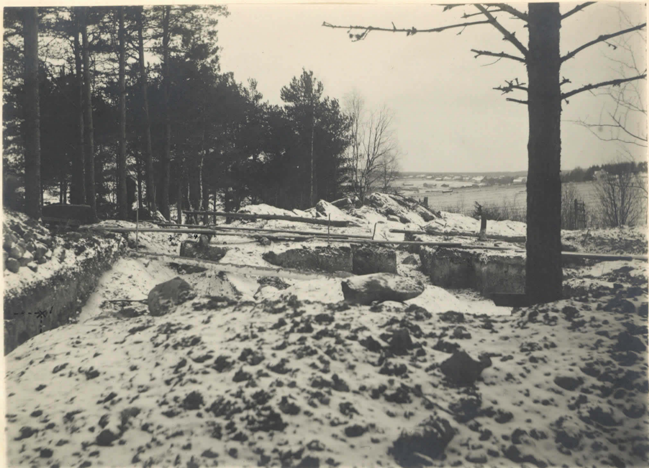
3. Byggnadsgrunden sedd från Ö mot V. Pl. 4521. I fonden kyrkobygn.