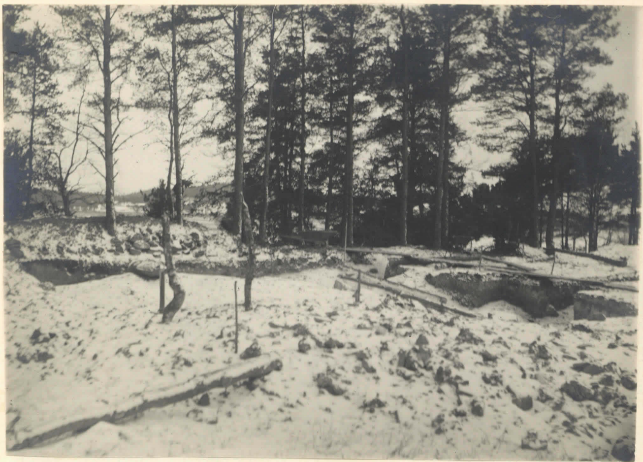
4. Byggnadsgrunden sedd från NO mot SW. I fonden Jämsä å och högra stranden. Pl. 4523.