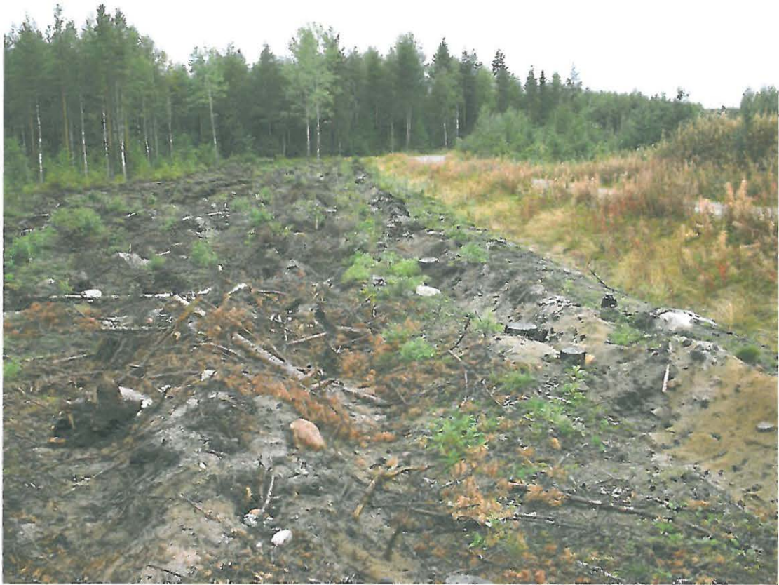
Kuva 1. Metsäautotien vierestä löytyi äesteyturista runsaasti kvartsi-iskoksia ja palanutta luuta.