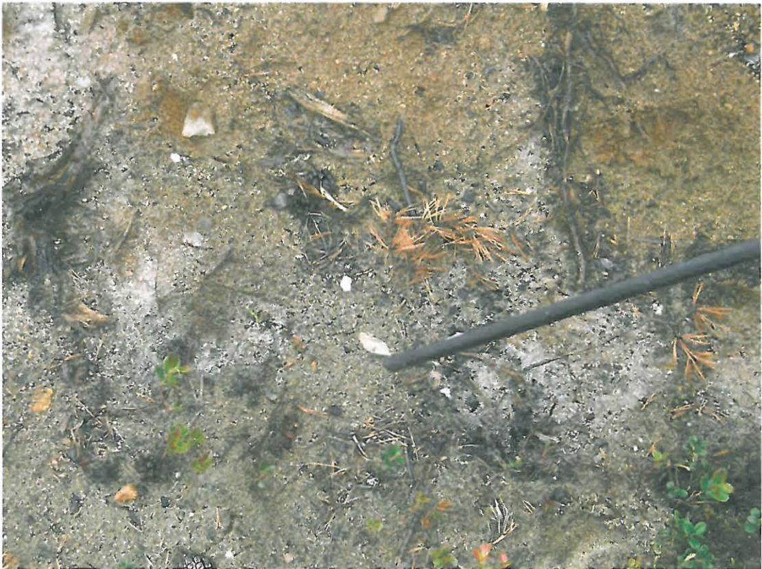
Kuva 2. Äesteyturista esiin tullutta kvartssia. Maaperä on hiekkaa.