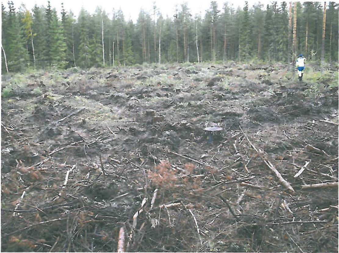
Kuva 3. Äestetty metsäkuvio; kvartssia löytyi erityisesti kuvan etualalta.