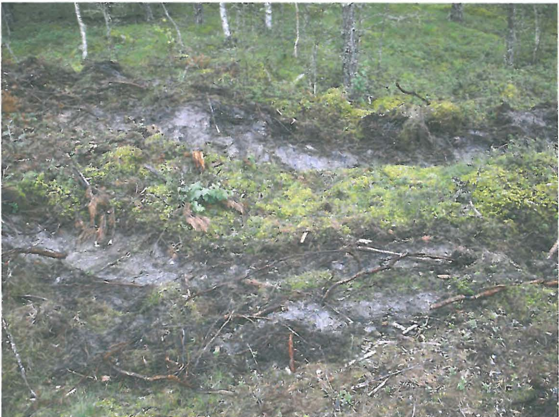
Kuva 4. Mahdollinen tuhoutunut asumuspainanne.