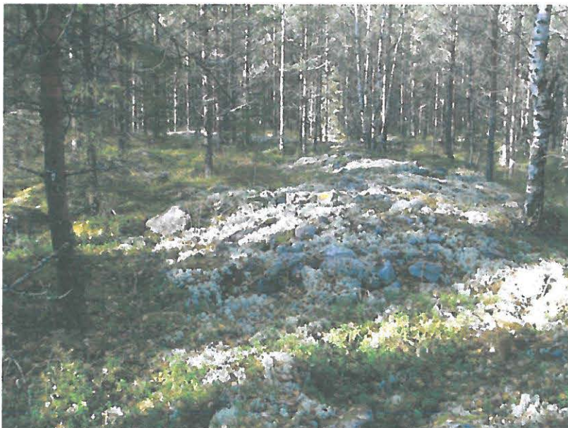
Itäreunan valla, pohjoispää näkyy.