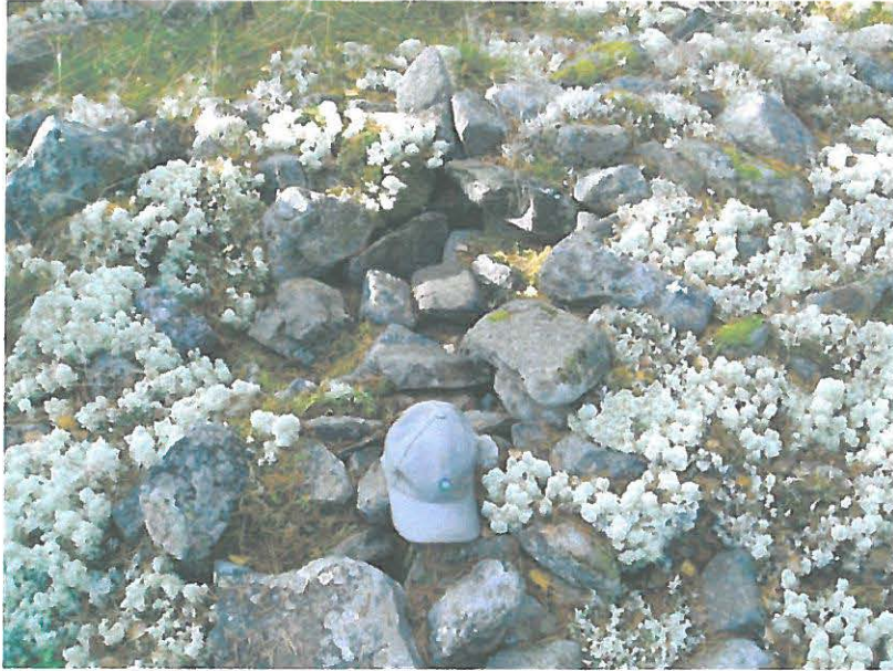
Uudehkoa penkomista pohjoispäässä.