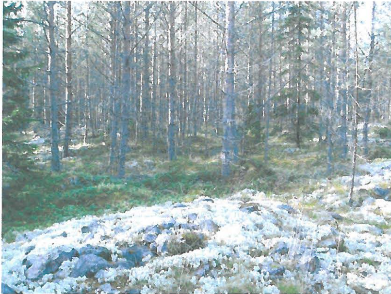
Vallin kaakkoispään röykiömäistä kivilatomusta ja vallin itäreunaa.