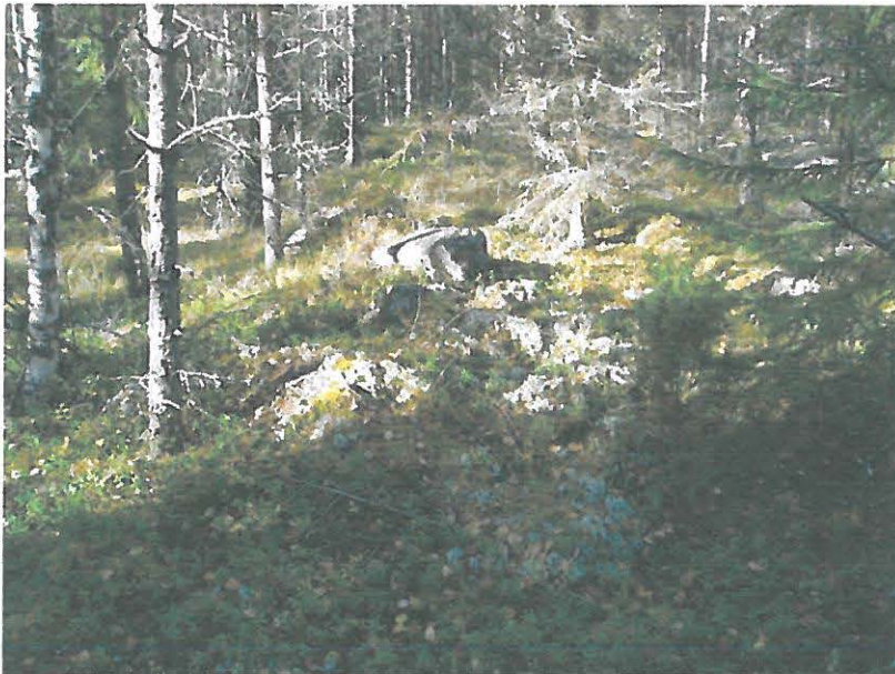
Länsireunan lohkareisempi valli nähtynä pohjoispäästä.