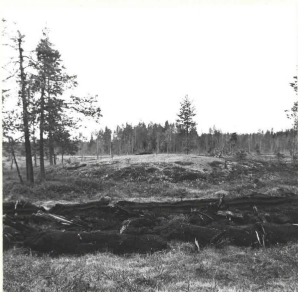
KUHMO 36 SAARIJÄRVI RISTISÄRKKÄ "KÄÄRMEIDEN KÄRÄJÄPAIKKA" PYÖREÄ MAAKUMPU SUOPERÄISEN ALAVAN MAAN KESKELLÄ. KUVA LÄNNESTÄ. F. 39087