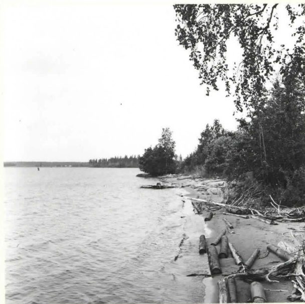
ORAVINIEMEN ASUINPAIKKA ON JO OSIT- TAIN HUUHTOUTUNUT ONTOJÄRVEEN. KUVA ETELÄSTÄ. F. 39070.