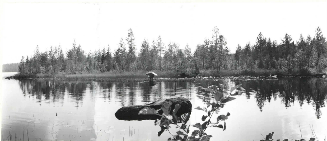
KUHMO [15] TAHKOJOEN NISKA. LAPINPATO. VEDENALAISEN PADON VOI HAVAITA SEN PÄÄLLE KASVANEESTA KASVILLISUUDESTA. TAKANA AVAUTUU ISO-TAHKONEN. KUVA PÖHJOISESTA. FF. 39074-76