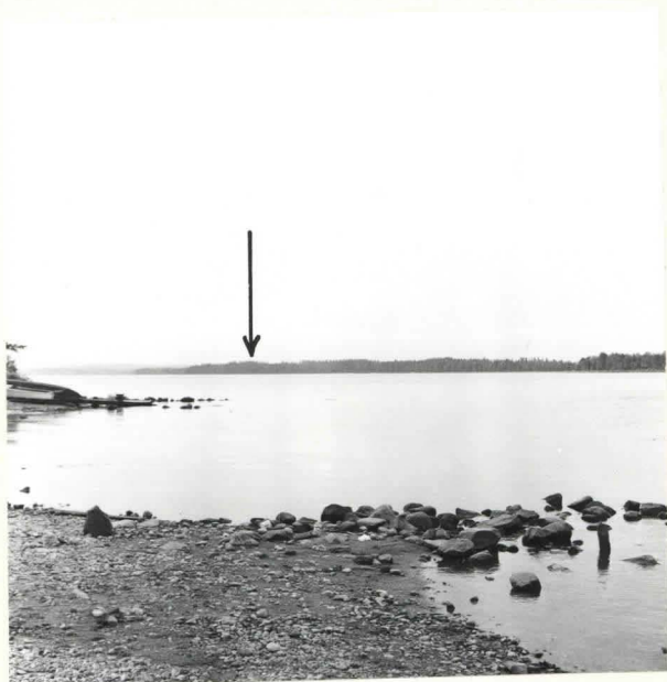
KUHMO 11 KOPISALMI SYLVÄJÄNNIEMI. KETJUNKANTAJAN KM 12755 LÖYTÖPAIKKA. KUVA KAAKOSTA. F. 39072.