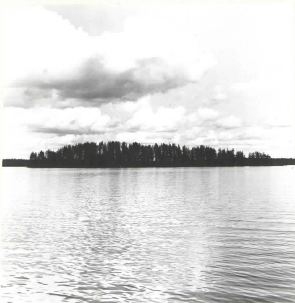
KUHMO 41 MURTOJÄRVI PÖYTÄSAARI. PÖYTÄSAARESSA ON LAPINHAUTOJA. KUVA ETELÄSTÄ.