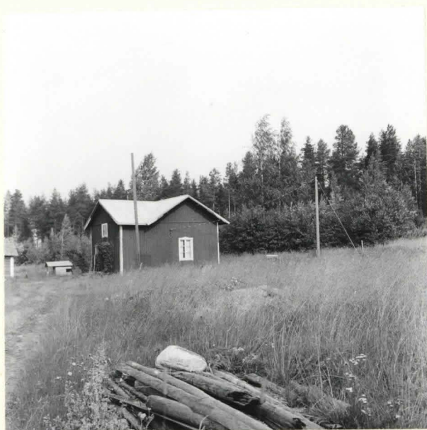
KUHMO 26 KATERMA KARANKA. KIVIKAUTINEN ASUINPAIKKA ONTOJÄRVEN ITÄPÄÄSSÄ KARANKALAHDEN ITÄRANNALLA. KUVA ETELÄKAAKOSTA. F. 39067