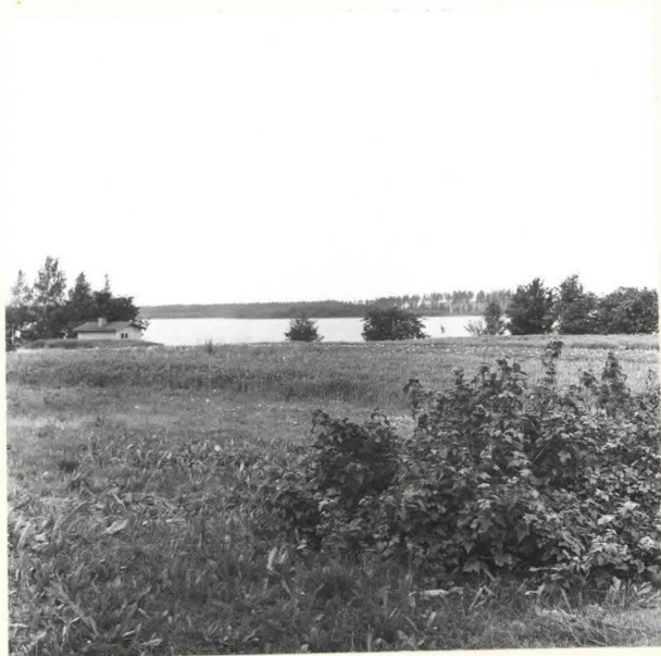
ORAVINIEMEN KIVIKAUTISTA ASUINPAIKKAA ONTOJÄRVEN LOUNAISRANNALLA. KUVA ETELÄSTÄ. F. 39069.