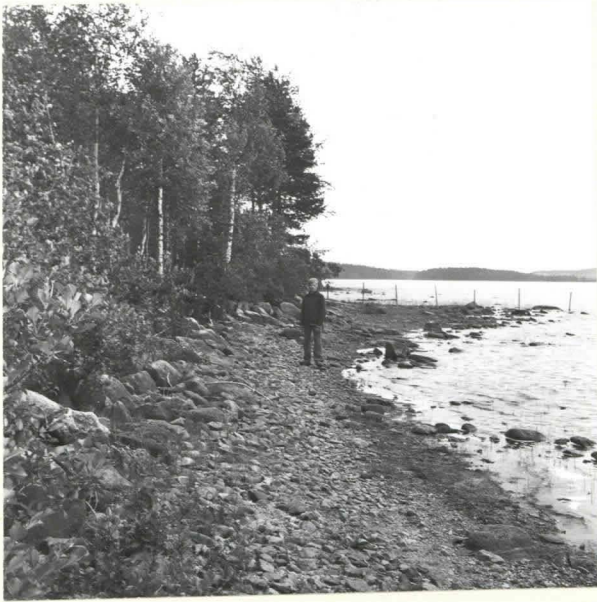
KUHMO [10] KALLIOJOKI PALONIEMI. PIIKEIHÄÄNKÄRJEN KM 18257 LÖYTÖPAIKKA JUOLUNKAJÄRVEN POHJOISRANNALLA. KUVA F. 39079 LÄNNESTÄ.