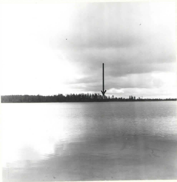
KUHMO [35] PIENI JUORTANA LAPINSÄRKKÄ. PIENEN JUORTANAN ITÄRANNALLA, NIEMESSÄ ON LAPINHAUTA JA VANHA ORTODOKSIKAL- MISTO. KUVA POHJOISESTA. F. 39080