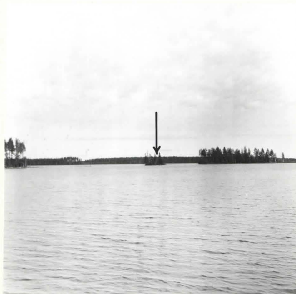
KUHMO 42 ONTOJÄRVI NAUKKARINSAARI. VANHA KALMISTOSAARI ONTOJÄRVEN LOUNAIS- PÄÄSSÄ. KUVA ETELÄSTÄ. F. 39073.