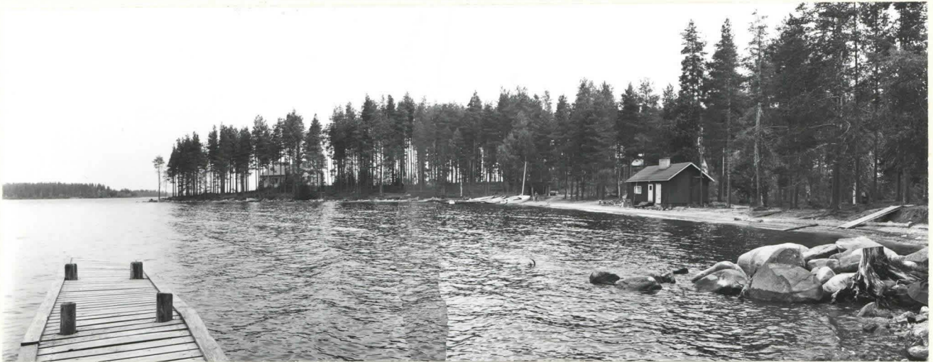
KUHMO 5 ONTOJÄRVI PALONIEMI. KIVIKAUTINEN ASUINPAIKKA ONTOJÄRVEN KAAKKOISRANNALLA. KUVA ETELÄSTÄ. FF. 39082-85.