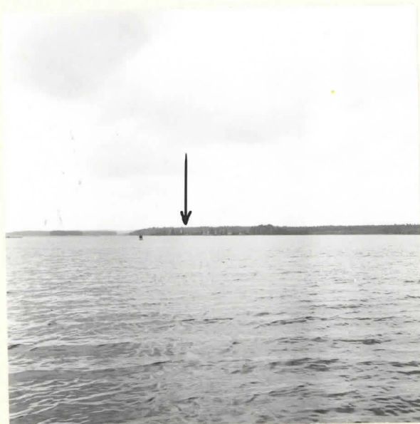
KUHMO 4 ONTOJÄRVI ANTTILA. KIVIKAUTINEN ASUINPAIKKA ONTOJÄRVEN LÄNSIPÄÄSSÄ. KUVA KAAKOSTA ORAVINIEMEN KIVIKAUTISELTA ASUINPAIKALTA. F. 39068