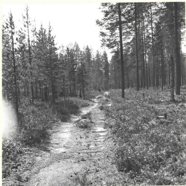
KUHMO 23 ISO-TAHKOSEN LUOTEISRANTA. KIVIKAUTINEN ASUINPAIKKA. ISO-TAHKONEN JÄÄ OIKEALLE. KUVA LOUNAASTA. F. 39066.