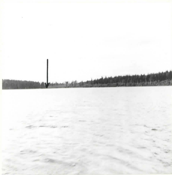
KUHMO [14] LENTIIRANJOEN NISKA. LAPINPATO NUOLEN OSOITTAMASSA PAIKASSA. KUVA IDÄSTÄ. F. 39077