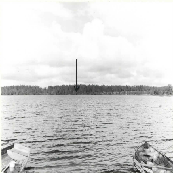
KUHMO [43] PIENEN JUORTANAN POHJOISRANTA. METSIKÖSSÄ LÄHELLÄ RANTAA ON LAPINHAU- TOJA. KUVA ETELÄKAAKOSTA. F. 39081