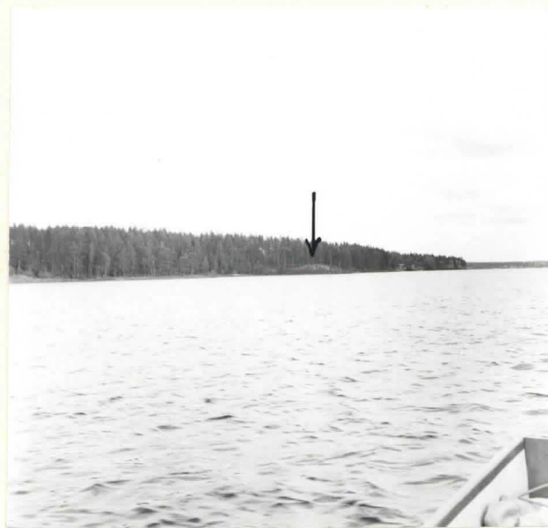
KUHMO [30] LENTIIRA KALMONIEMI. VANHA KALMISTONIEMI, JOSSA NÄKYVILLÄ JOITAKIN HAUTAPAINAUMIA. KUVA LÄN- SILOUNAASTA. F. 39078