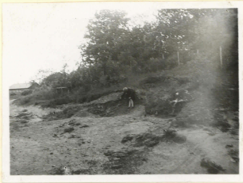
N 15666. Naisen hauta pikkupappilan rakennuksen edessä.