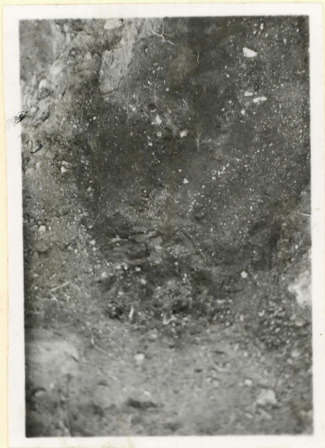
N 15667. Hauta - Parvion pääpuoli paljastusvaiheissa.