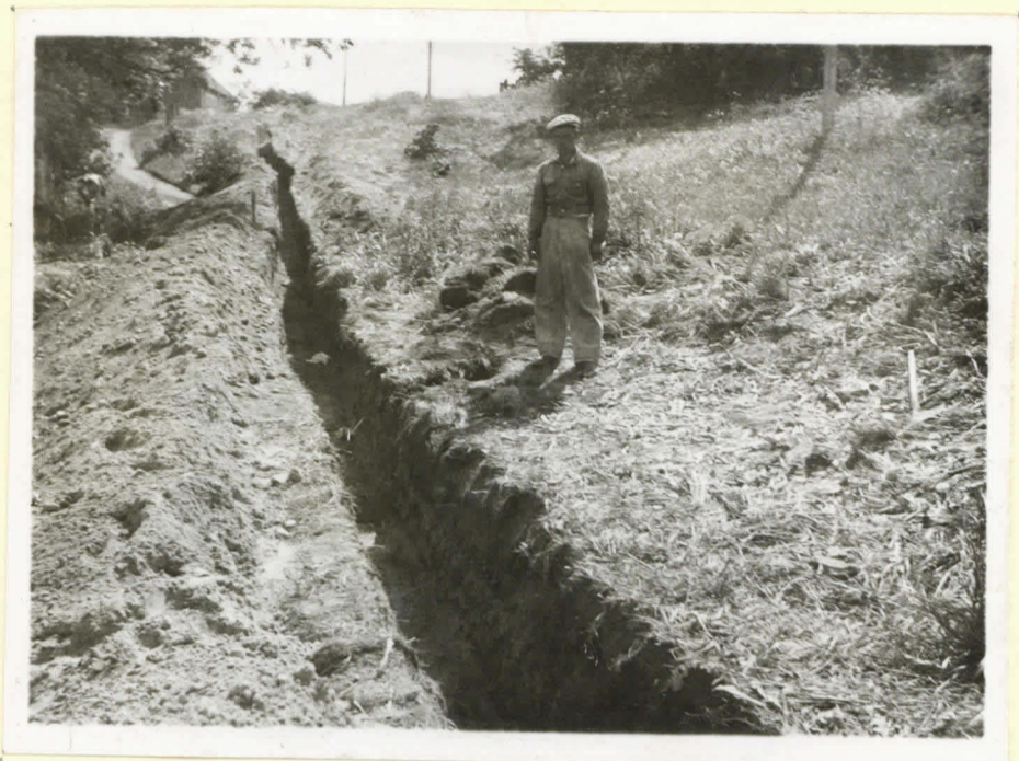
N 15668. Niemenhauta, kaapeli- ojan leikkauksessa seisovan työmiehen oikeaa puolella.