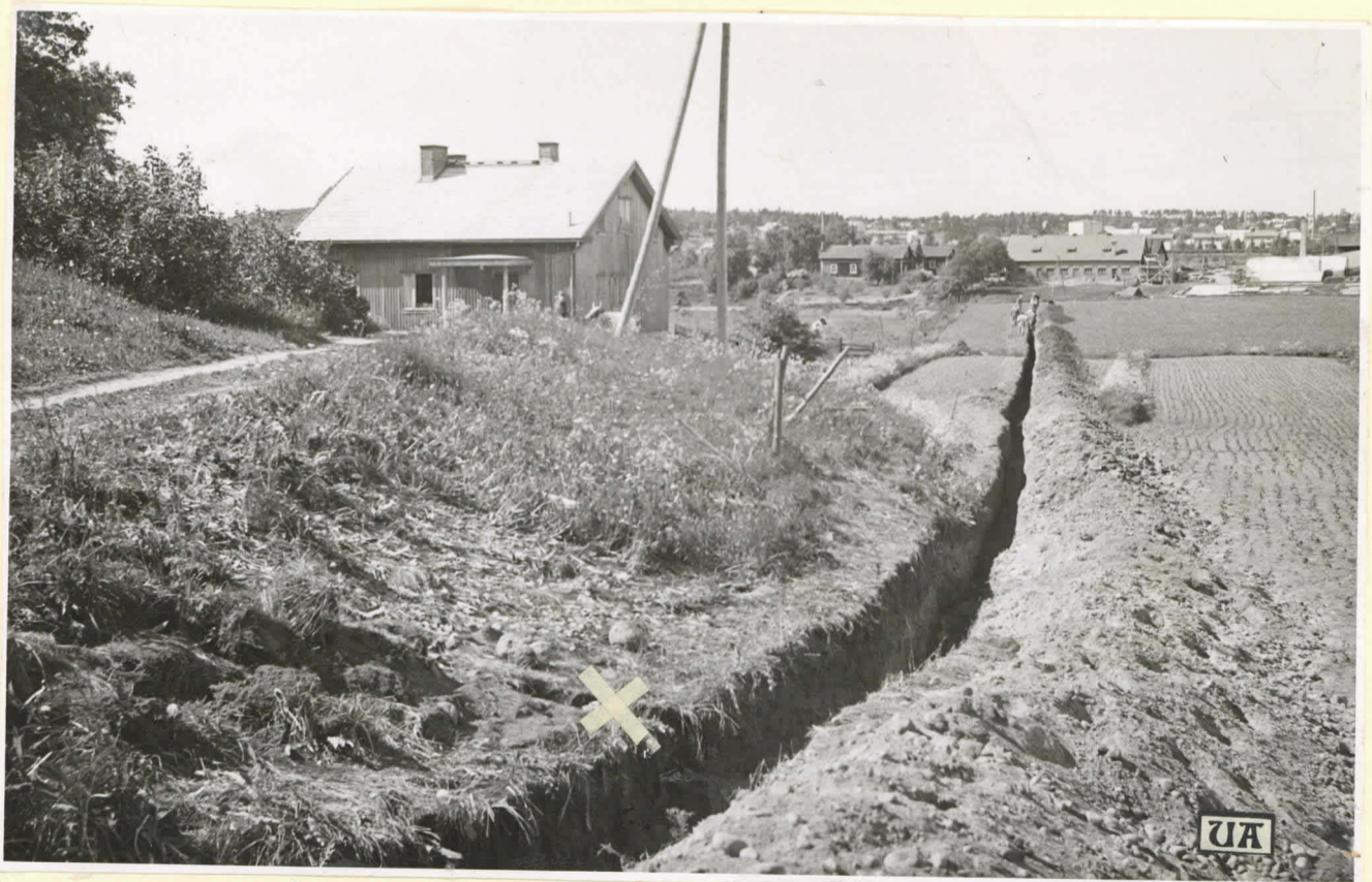
N 15669. Niemenhauta etualalla kaapeli- Basemmalle jätetty tyvän leikkauksen paikalla. Takana pitkä pappila.