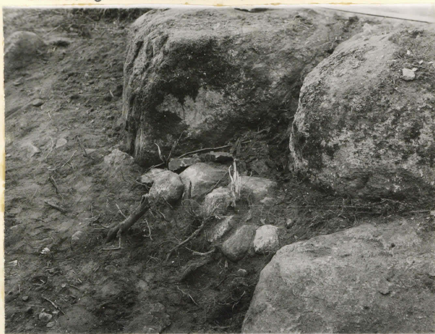
N=6. Ravattula, Pähkinämäki. Hautaröykkiön keskuskivet.