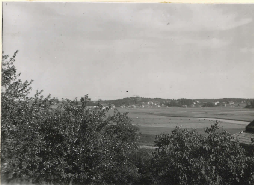
N=3. Näköala Pähkinämäen löytö- paikalta itään.