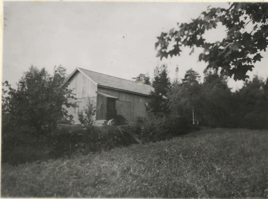
N=2. Ravattula, Pähkinämäki Hautaröykkiö kuusen ja vajarakennuksen välissä.