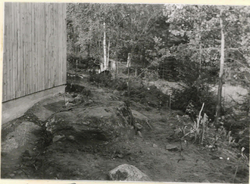
N=5. Ravattula, Pähkinämäki. Hautausmaun tutkimuksen aikana valok. idästä