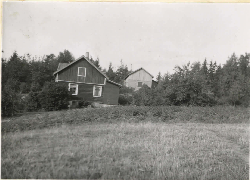
N=1. Ravattula, Pähkinämäki. V 1947. Tutkittu hautaröykkiö sijaitti heti vajarakennuksen oikealla puolella.