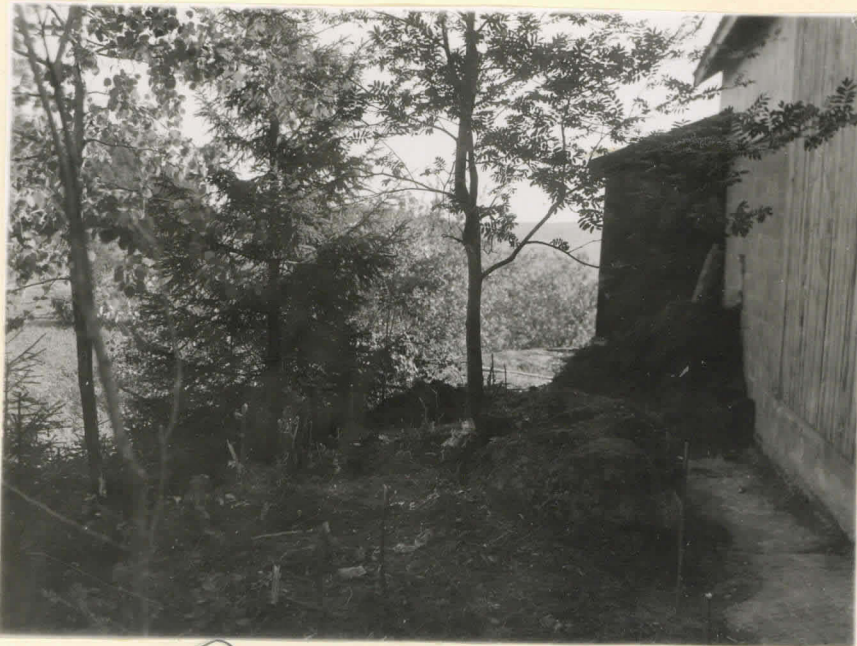
N=4. Ravattula, Pähkinämäki. Hautausmaun jäljellä oleva osa ennen kaivautta. Valok. lännestä