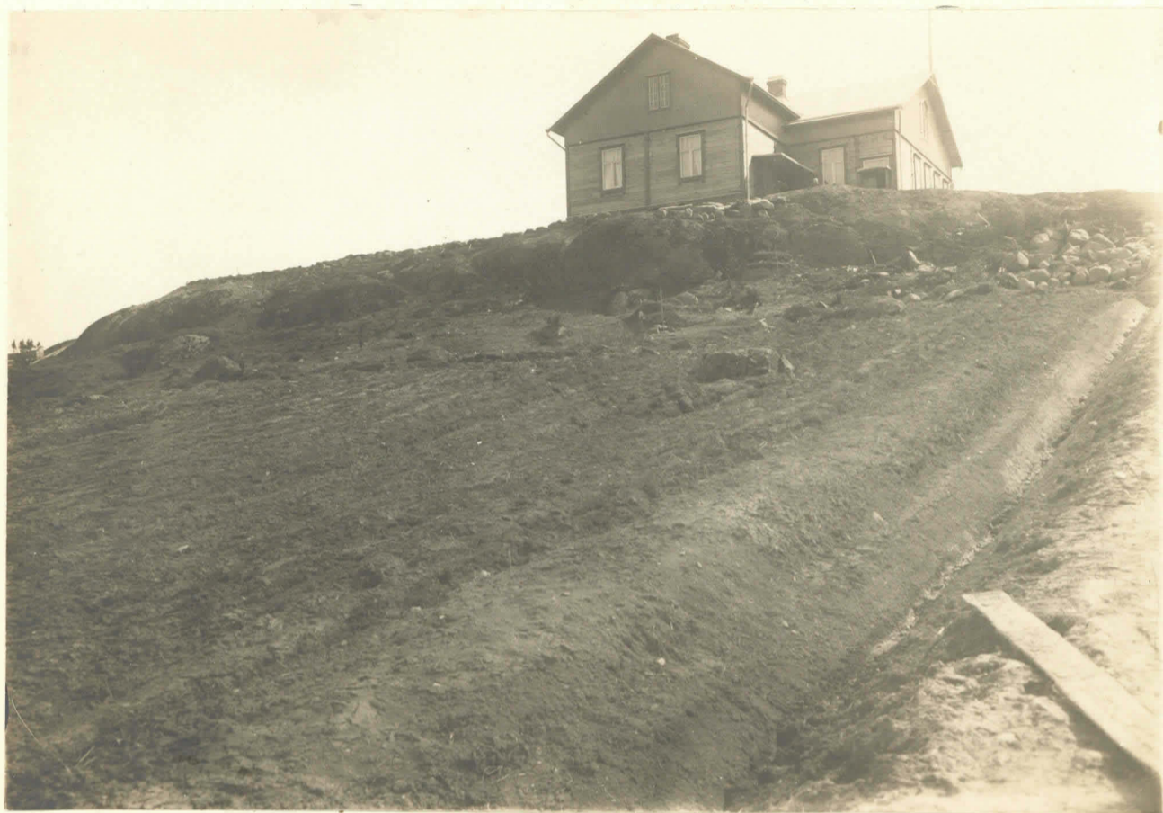
Haarina. Ristinmäen kalmisto jokisammasta. lev. 4374.