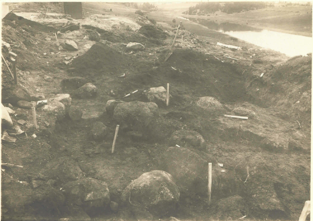
Ristimäen kalmiston kivitystä. V-VI k-m. no. 4373.