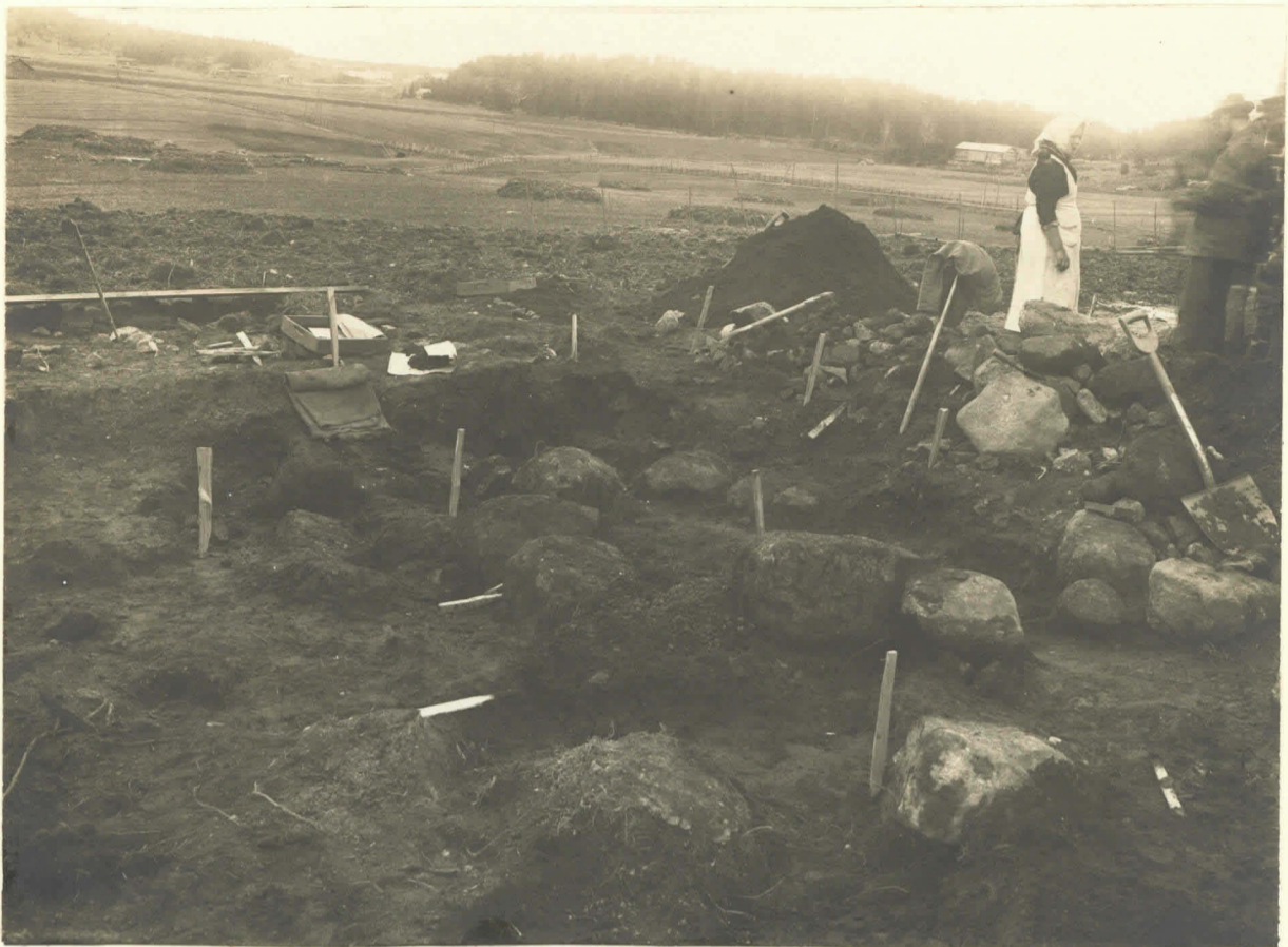
Haarina. Ristimäen kalmiston kivitystä. V-VI k-m. no. 4372.