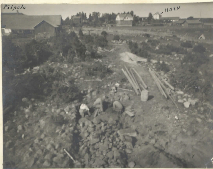
Kalmumäki, valokuvaatte mylly- rakennuksen katolta NO suuntaan.