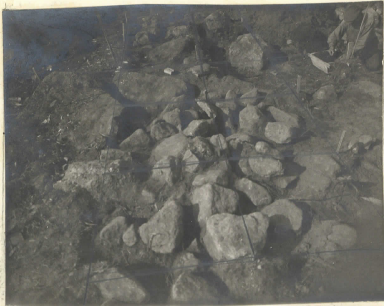
Rivilatomus muodulla h, i 9 ja 10