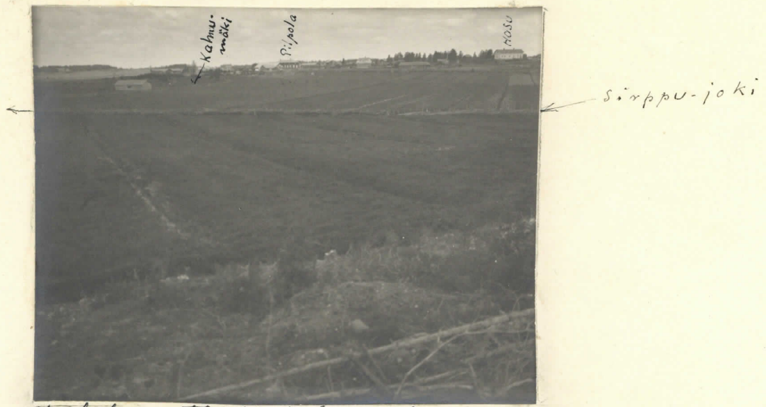
Valokuvaatte Kallalan kylän tieltä. Katso karttaa n: 1.