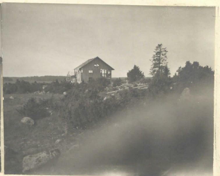
Kalmumäki. Kuvat 3 ja 4 otettu Kalmumäen NO kulmasta SW suuntaan. Katso karttaa n: 2.