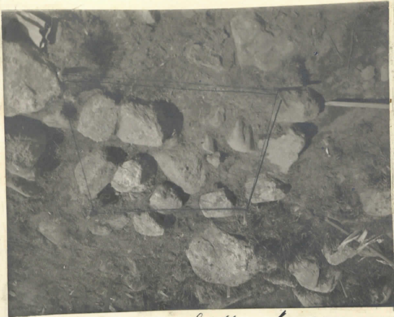
Riveys muodulla 6, 9 Kantta n o 3 a