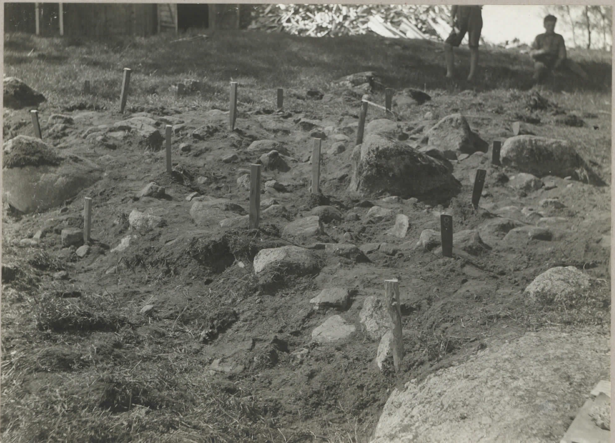
4. Resultati ös försöksgrävning framför "maskinhuset" år 1932.