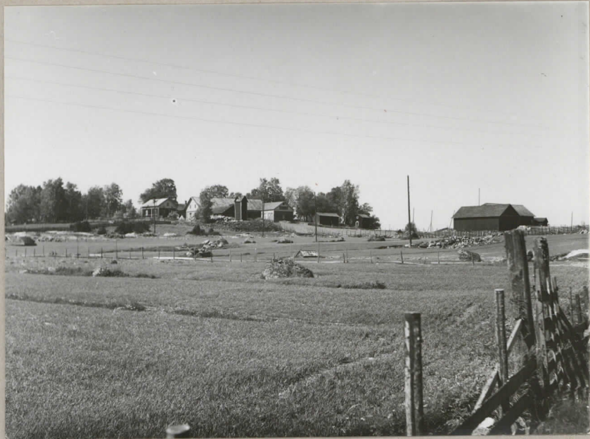
1. Nokkola hemman i Halla by, sett från S.O. pl. 8131.