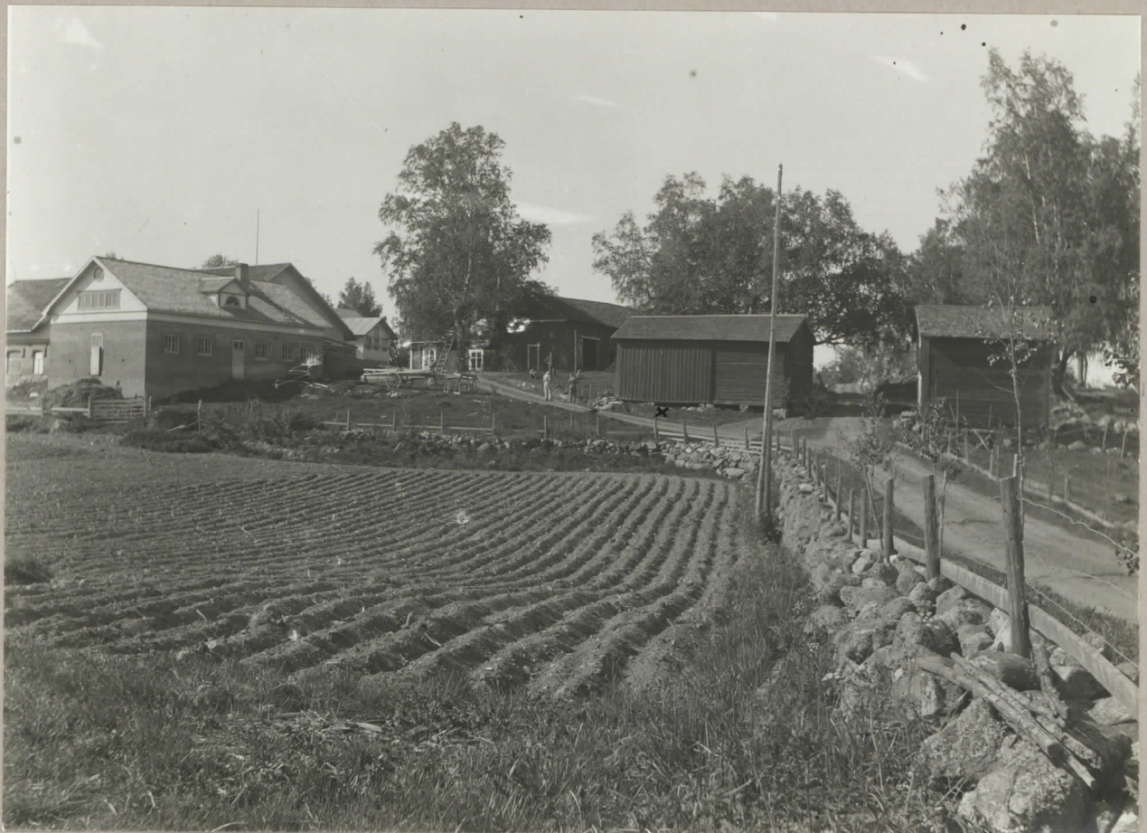
2. Nokkola hemman från N; vid x, framför "maskinhu- set", brandgraven H. n. 19502. pl. 8095.