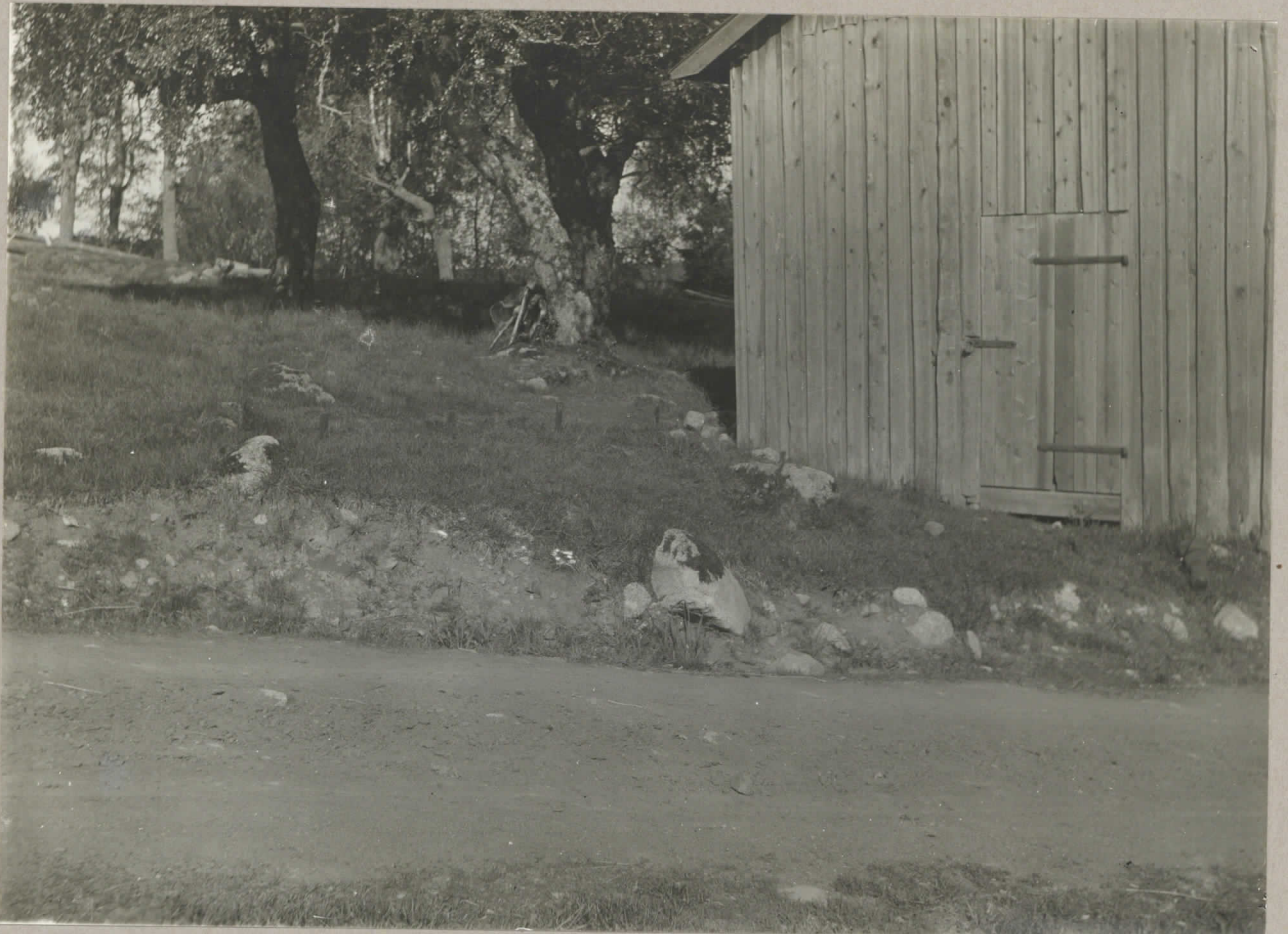
3. Till höger "maskinhuset" på Nohkola.