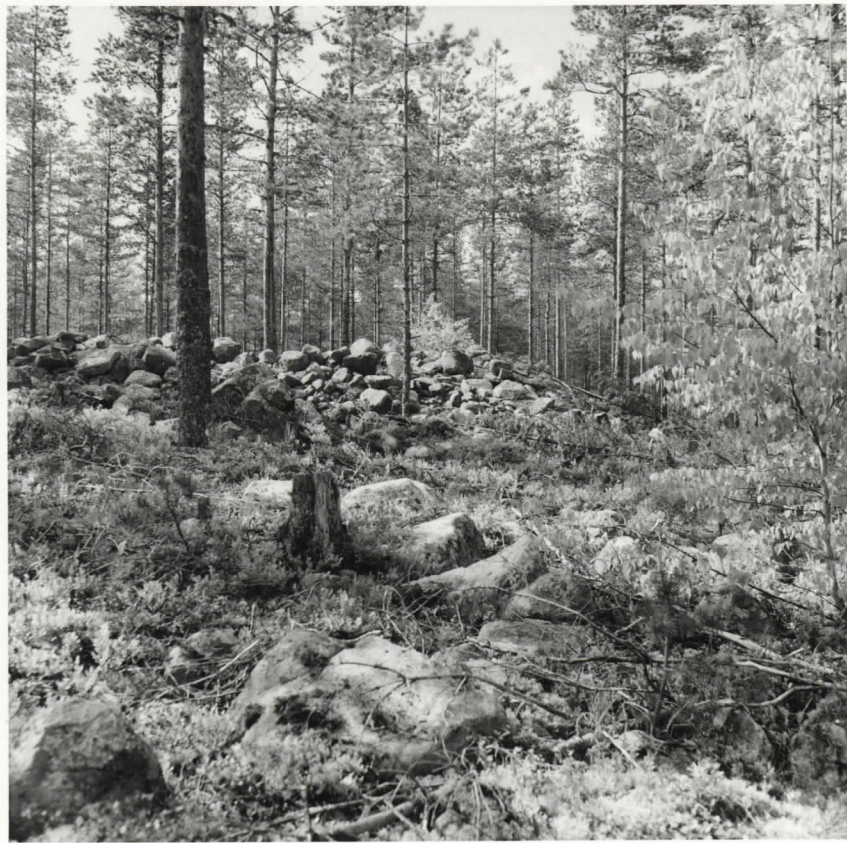
Mäenlaella sijaitseva kookas raunio