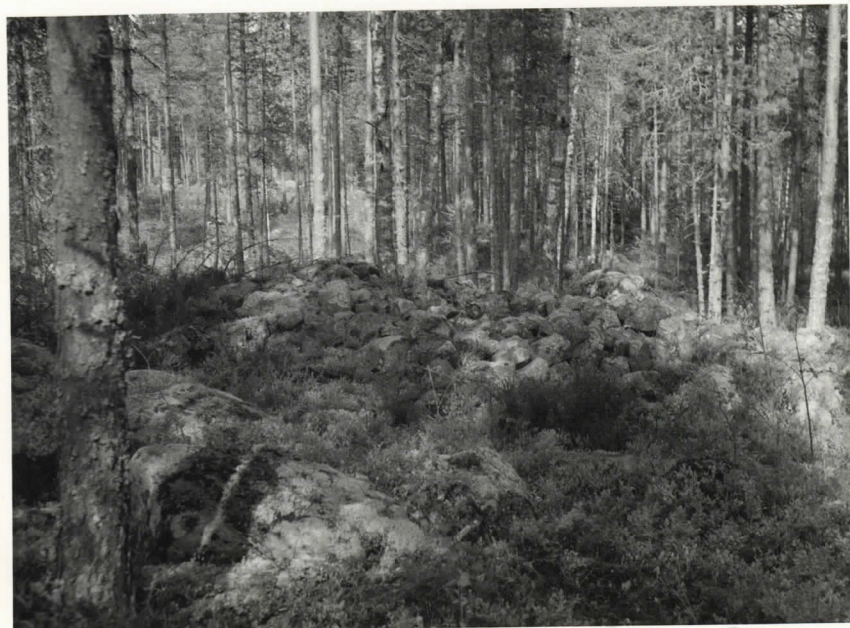
Neg. Sat. mus. 16358