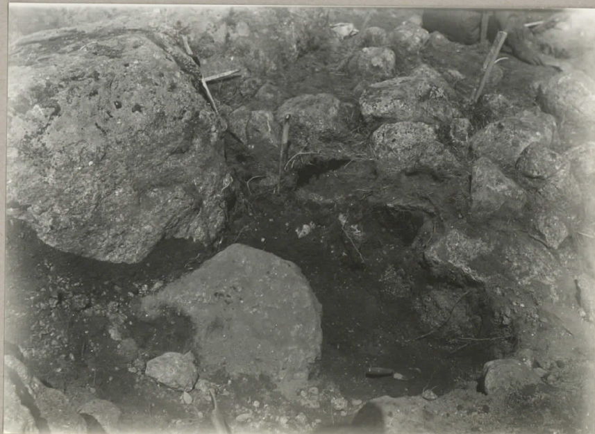
3. Rötan f 6. under pågående grävning från SSW-NNO. pl. 8033.