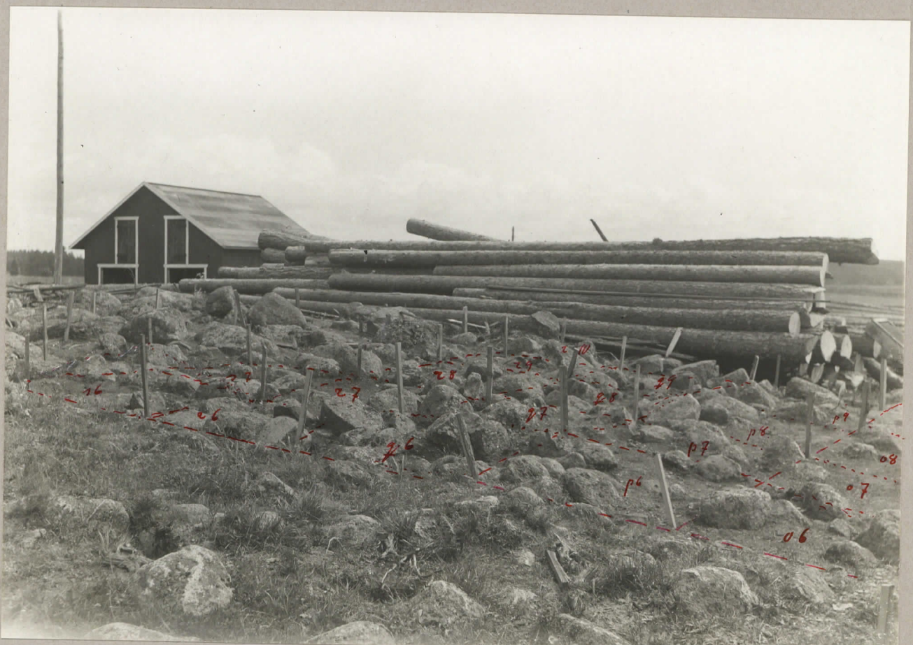
7. Kalmumäki. Det 1931 undersöktas område's södra del.