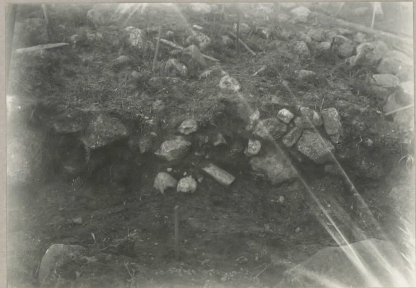
4. Skärningen längs norra gränsen av rötorna i 8, i 9, (i 10). pl. 8034.