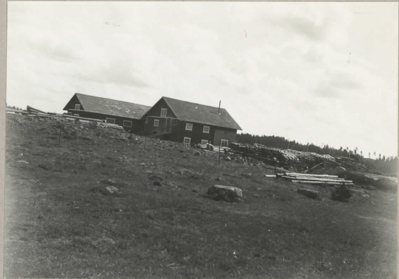
2. Kalmumäkis västra delning. pl. 8032.