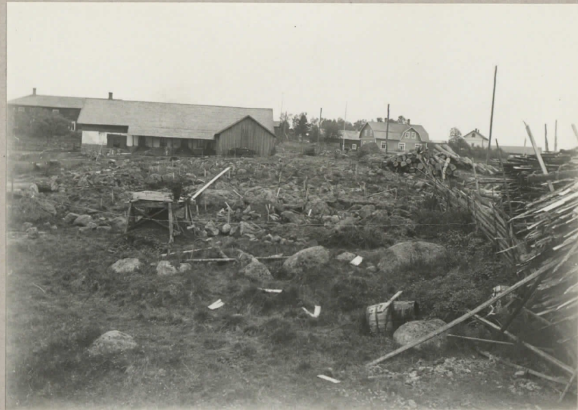
1. Kalmumäki gravfältets västra delning. pl. 8031.