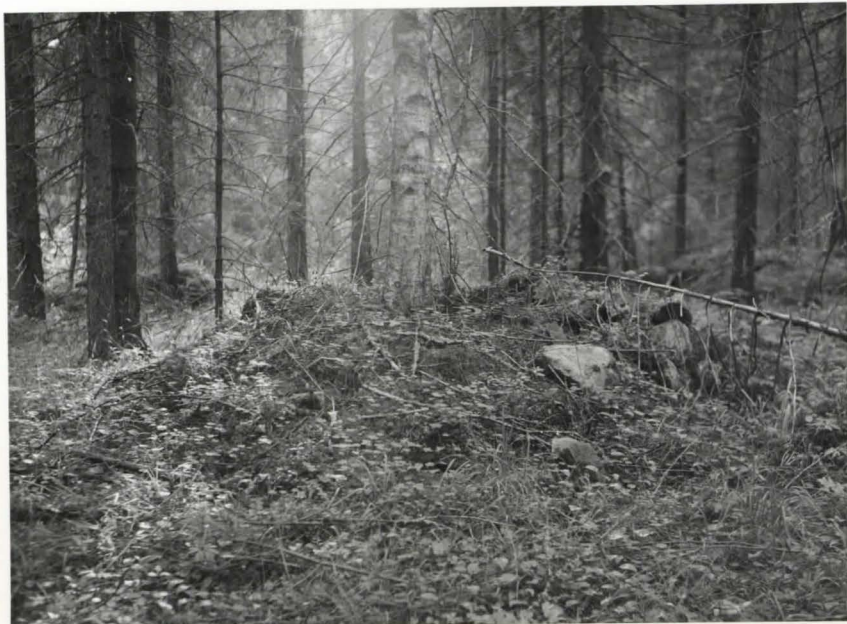
Kaltevon met- sä, hautarau- nio 2. Neg. Sat.mus. 10801.