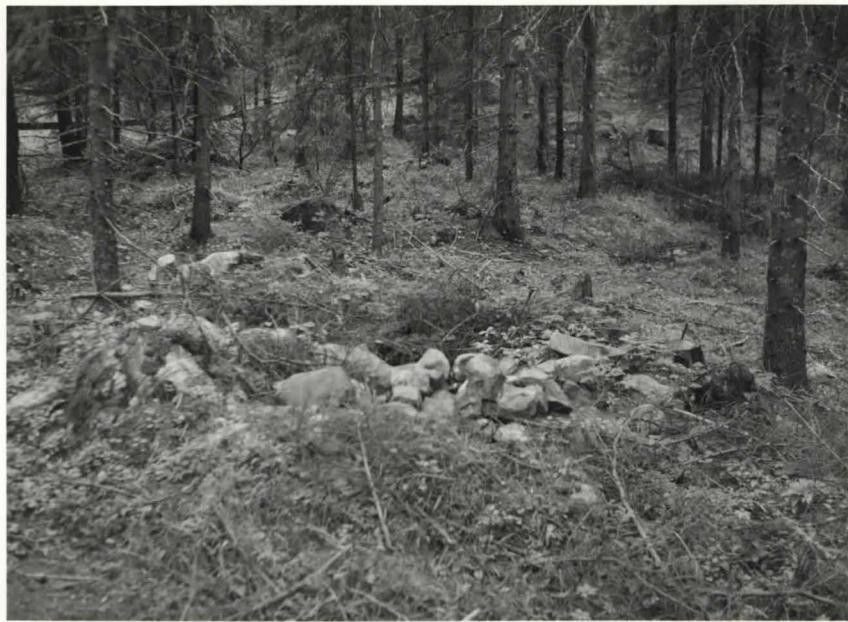
Eskolan met- sä, hautarau- nio 17. Neg. Sat.mus. 10799.