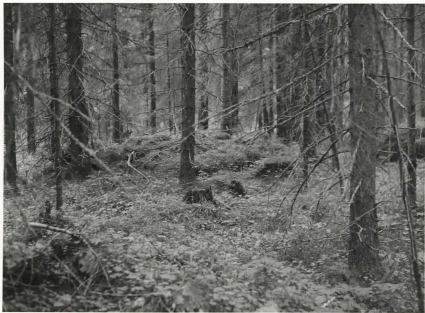
Kaltevon metsä, hau- taraunio. Neg. Sat.mus 10800.