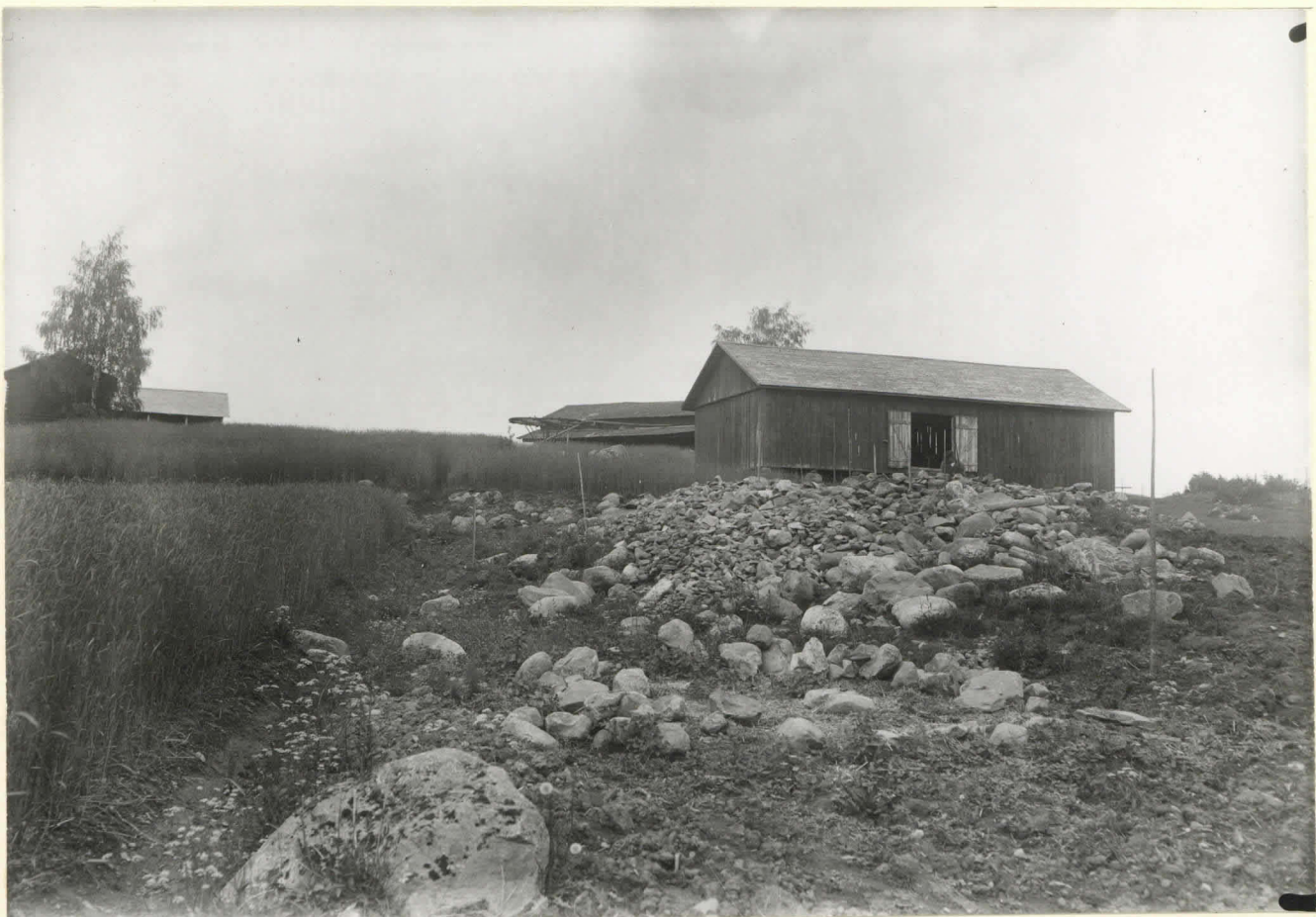
Rautala. Roukhis 5253 remman puolelta. luv. 5254.