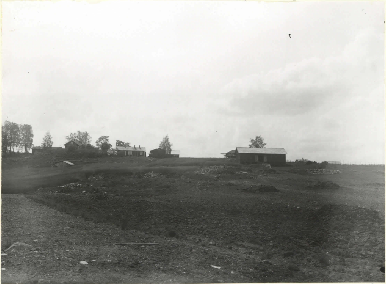
Rautalan riihipelto valok. järven rannasta ylöspäin. lev. 5255.