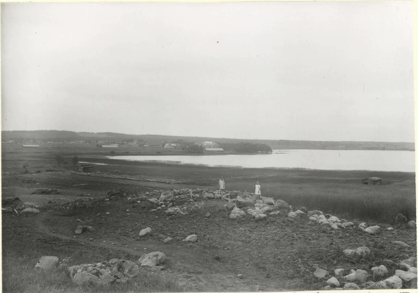
Rautala. v. 1918 tutkittu kiviroukhis talon luv. 5253. riihen luota.