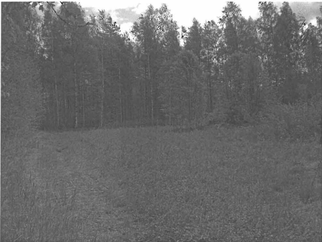
Kuva 2: Pellon pohjoisreuna vasemmalla, kuvattuna kohti itää.