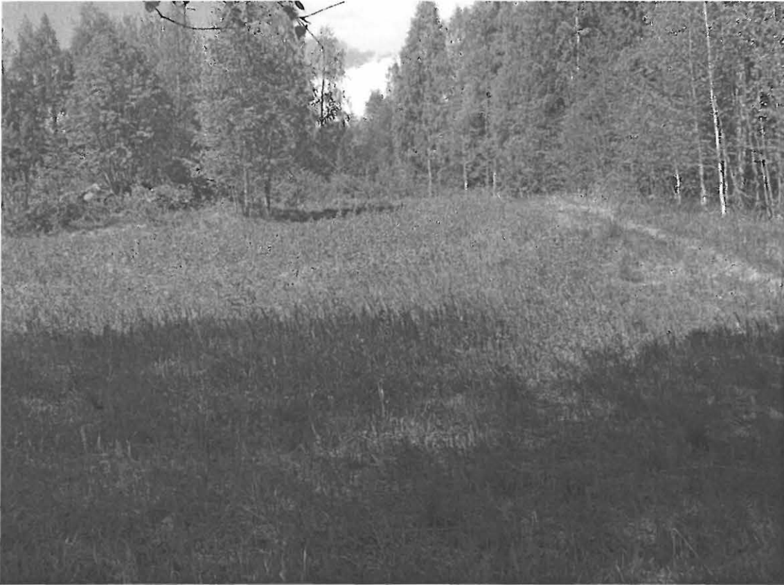
Kuva 1: Pellon itäreunasta kohti länttä (tietä) katsottuna.