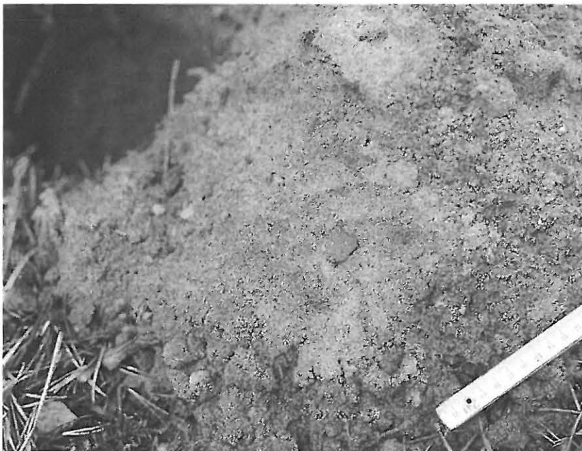
F.a. 4270 KUVA 2: Lapionpistolla hiekasta löytynyt saviastian palanen. Valok. Jouko Aroaho, 6x4,5, 1.9.2001.