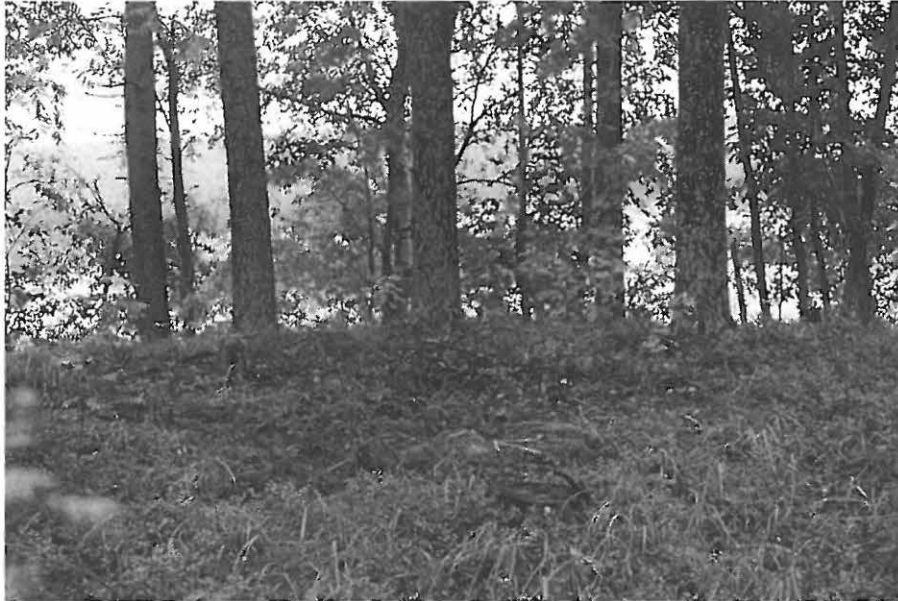
F.a. 4271 KUVA 1: Asuinpaikka lännestä kohti rantaa nähtynä. 6x4,5, 1.9.2001.