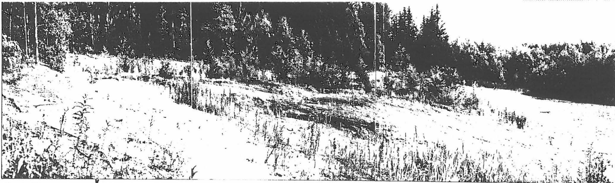
Fa. 4053 - 4055. KUVA 1: HIEKANOTTOPAIKKA HALMEJOEN PAINAUMASSA, NÄHTYNÄ KOHTI KAAKKOA. LÖYDÖT ON TOISAALTA VASEMMALLA NÄKYVÄN LAPION KOHPALTA, TOISAALTA KESKELLÄ OLEVAN LEIKKAUKSEN KOHPALTA.