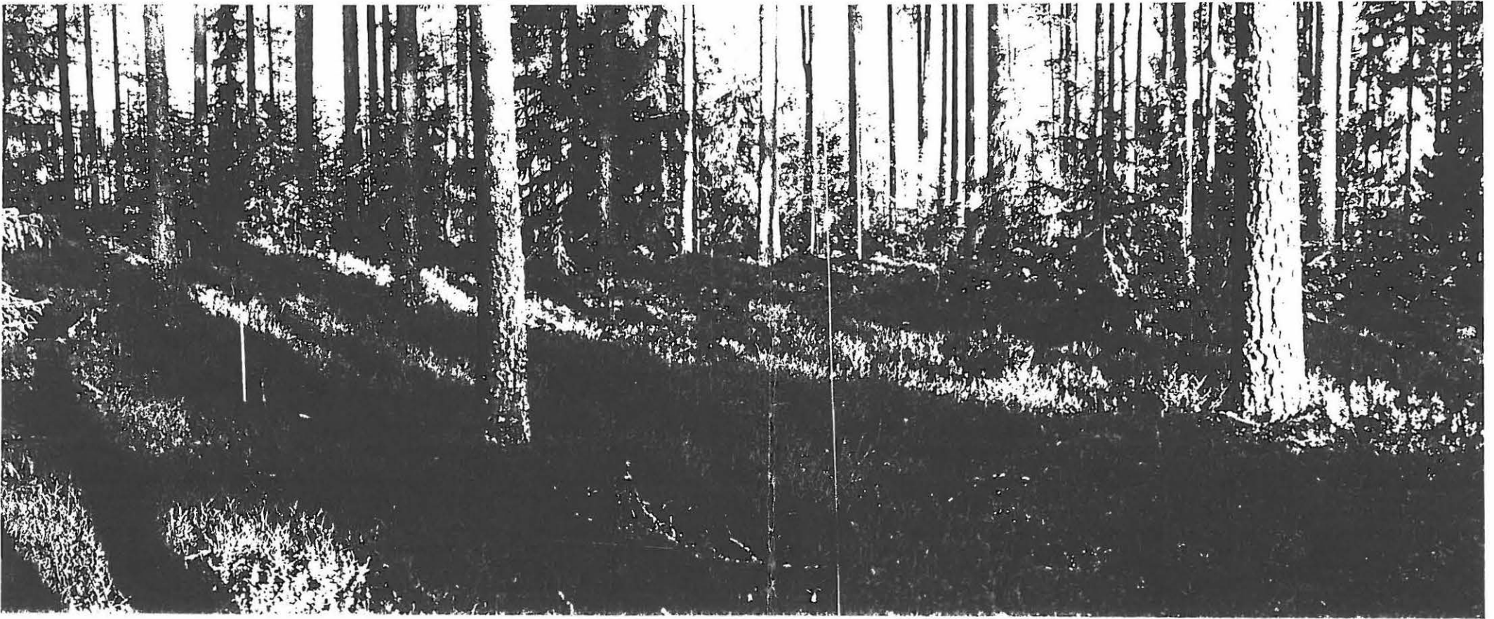
KUVA 1 : KAMPAKERAMIKAN PALA (KUM) LÖYTYI LAPIONPISTOSTA, VASEMMALLA MITAN KOHDALLA. VASEMMALLA PUIDEN VÄLISTÄ NÄKYVÄ MUUNTAMO, VALOKUVASSA LÄNNESTÄ KATSOTTUNA. 6 x 4,5, 20.9.1997.