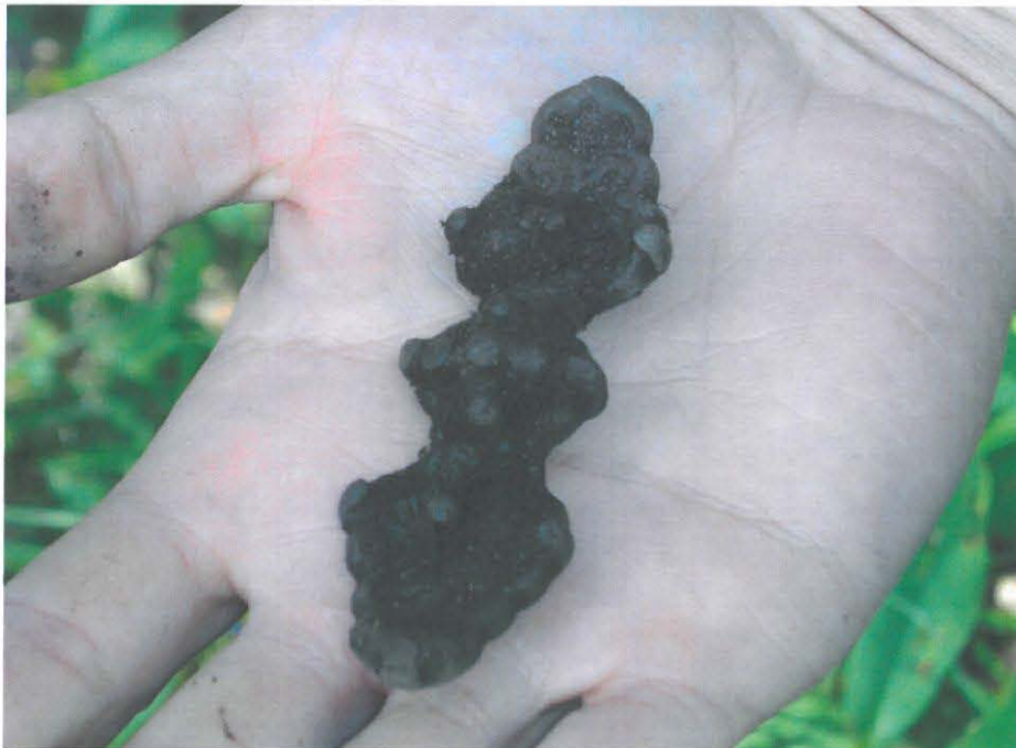
Rautsaarenkärjestä löydynyt tasavarsisolki .