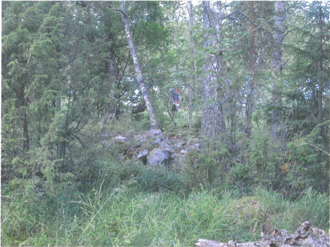
Kuhmoinen Rautsaarenkärki. Eteläinen röykkiö. Kuvattu koillisesta.