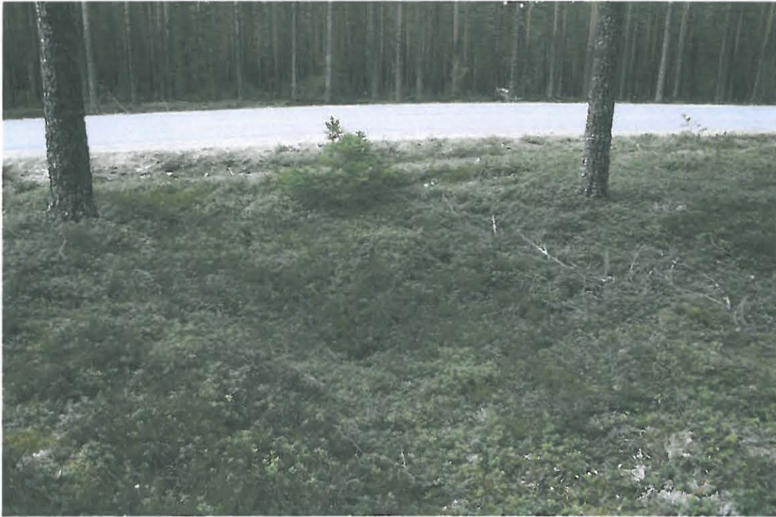
Kuva 1. Kohde sijaitsee aivan Kuortaneelta Alajärvelle johtavan tien vieressä, Hiekkakankaalla, pääosin tien itäpuolella.