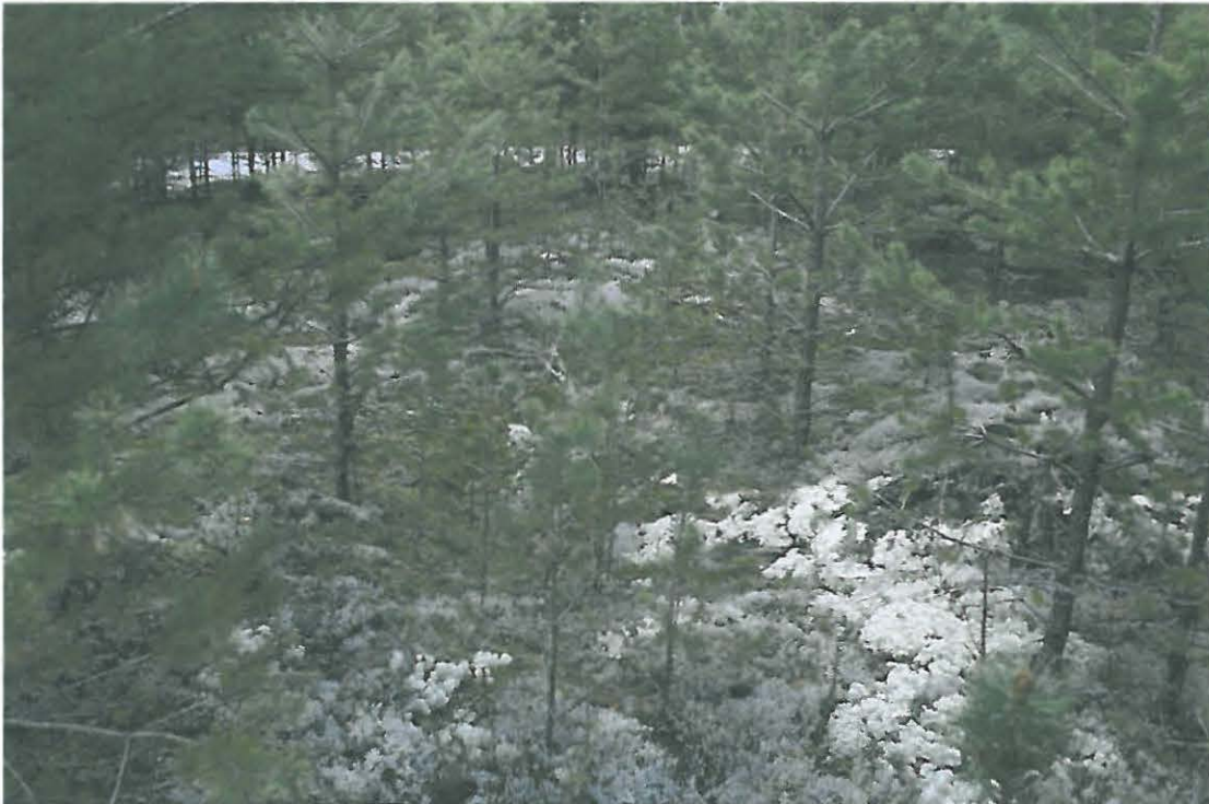
Kuva 2. Osa painanteista sijaitsee noin 10 vuotta vanhassa mäntytaimikossa.