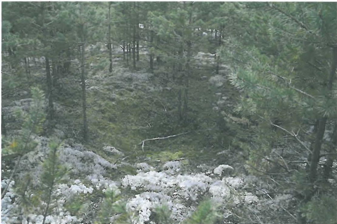
Kuva 4. Painanne.