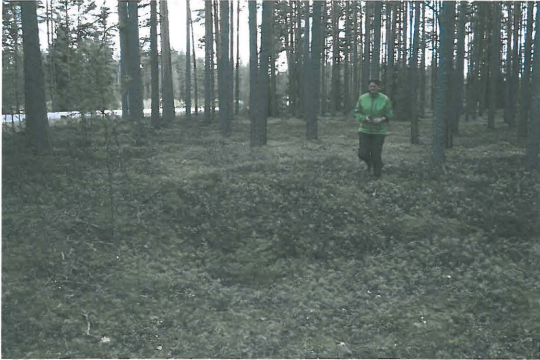
Kuva 3. Osa painanteista sijaitsee jo vanhempaa mäntyä kasvavalla kankaalla.