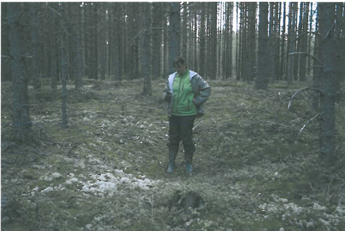
Kuva 4. Kuopista otettiin GPS-koordinaatit.