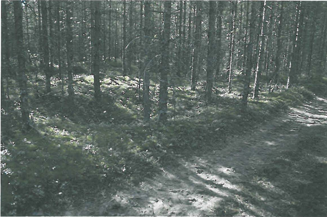
Kuva 1. Kohde sijaitsee metsätien varrella.

KERTOMUKSEEN LIITTYVÄT KUVAT, KUVAAJA KARI VÄISÄNEN: