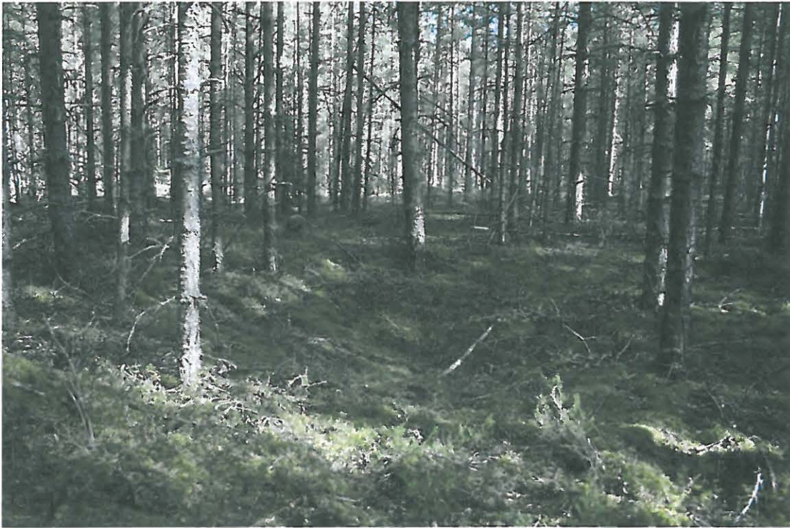
Kuva 7. Painanne.