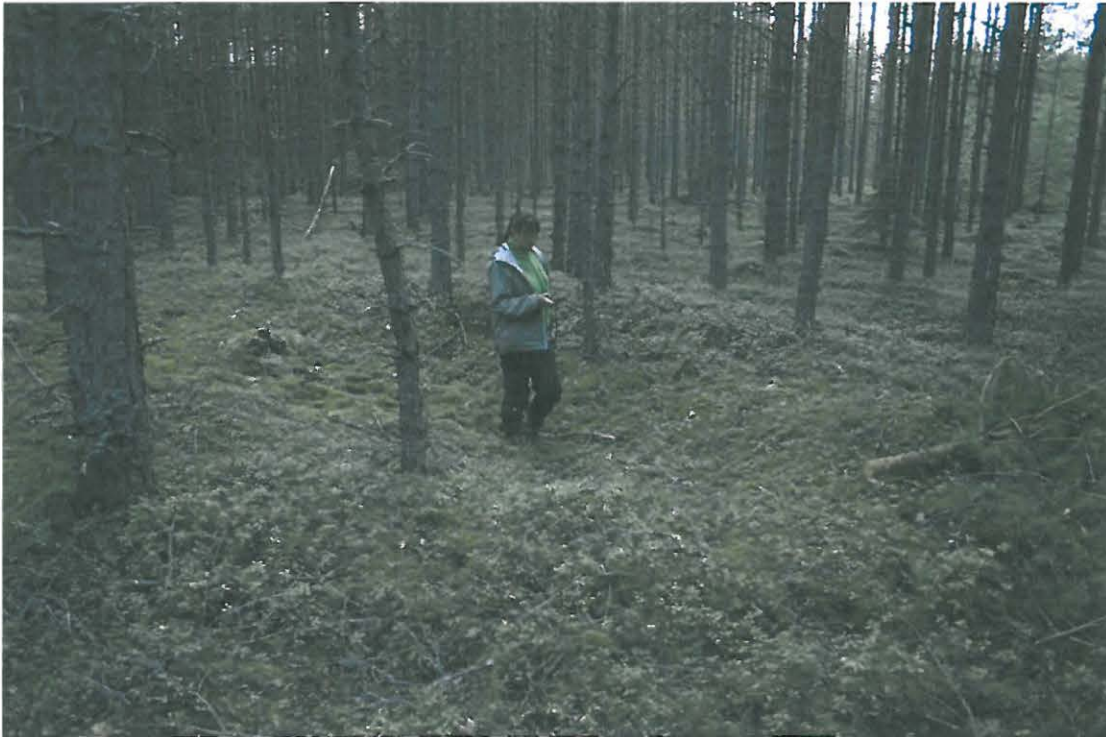
Kuva 5. Painanne.