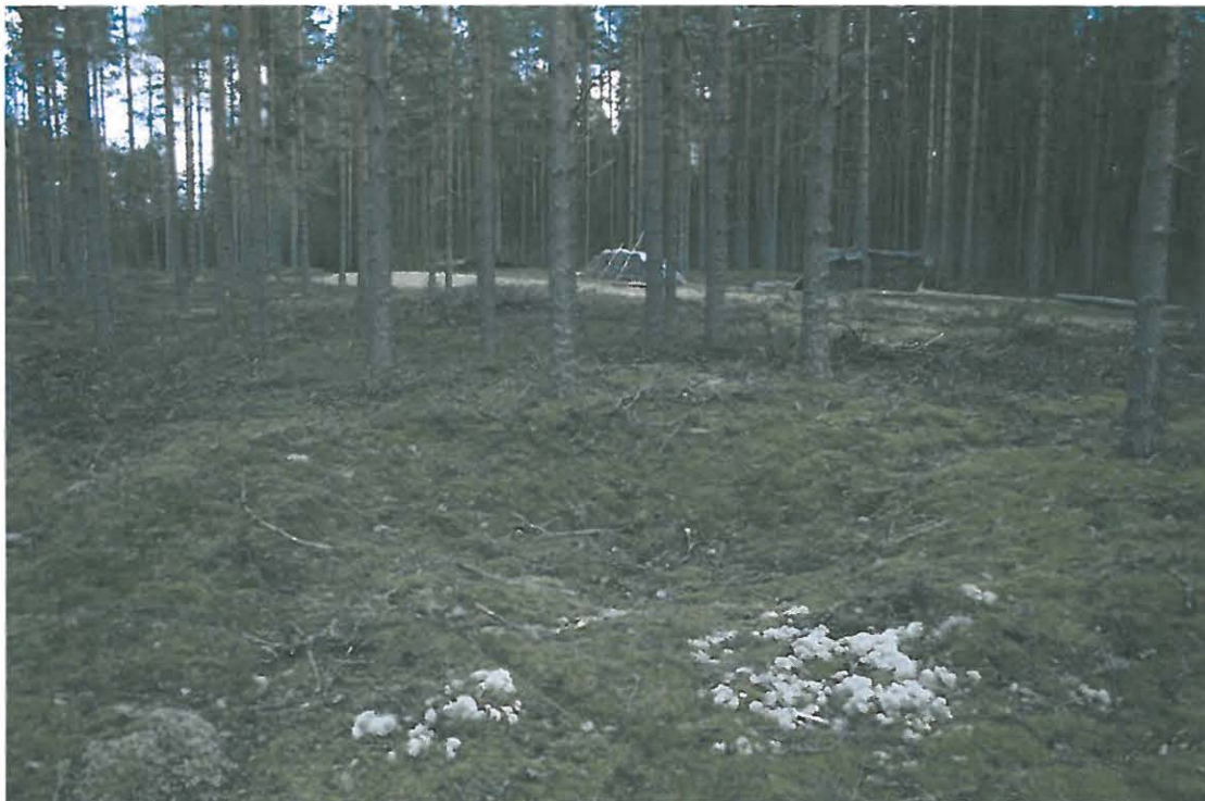
Kuva 6. Painanne.