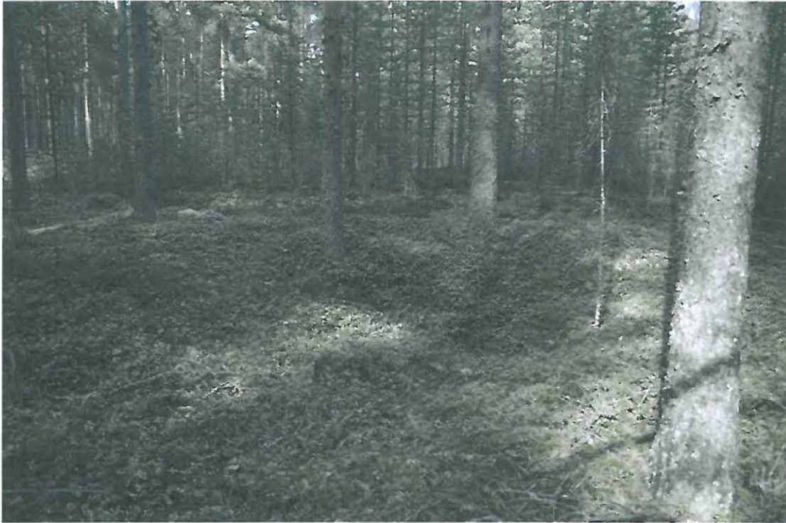
Kuva 3. Painanteet erottuivat hiekkaisella mäntykankaalla hyvin.