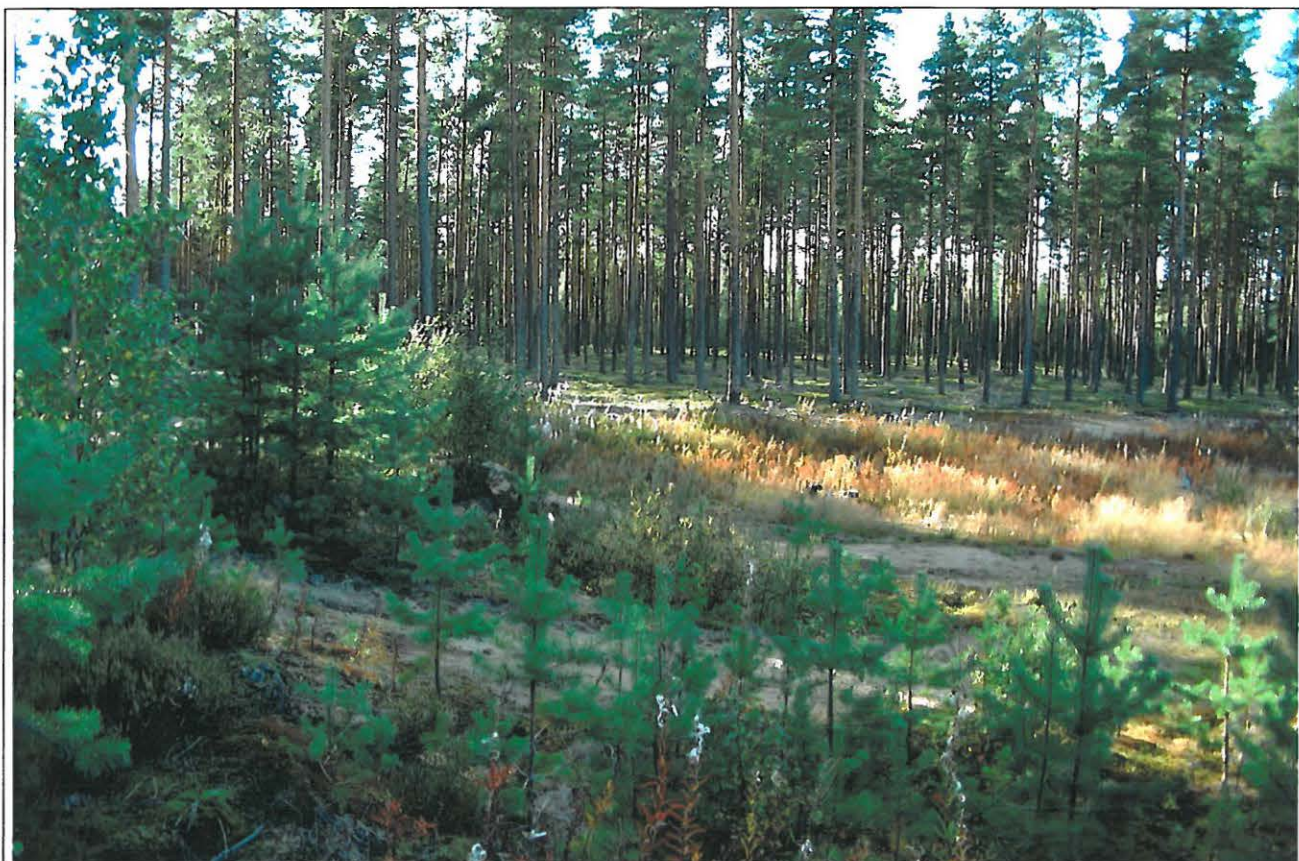
Kuva 1. Löytöalue 2.a. Kvartsi-iskoksia löytyi taustalla olevasta hiekkakuopan leikkauksesta sekä kuvanottoaikan tienoilta tien pinnasta. Kuvattu luoteeseen.