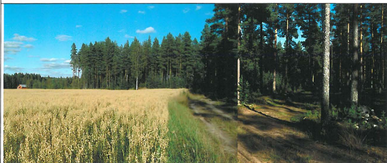
Kuva 2. Löytöalue 2.b. Löytöjä pellon laitaa kulkevan tien pinnasta, tienhaarasta noin 30 metrin matkalta (kuvaaajasta poispäin). Kuvattu itään.