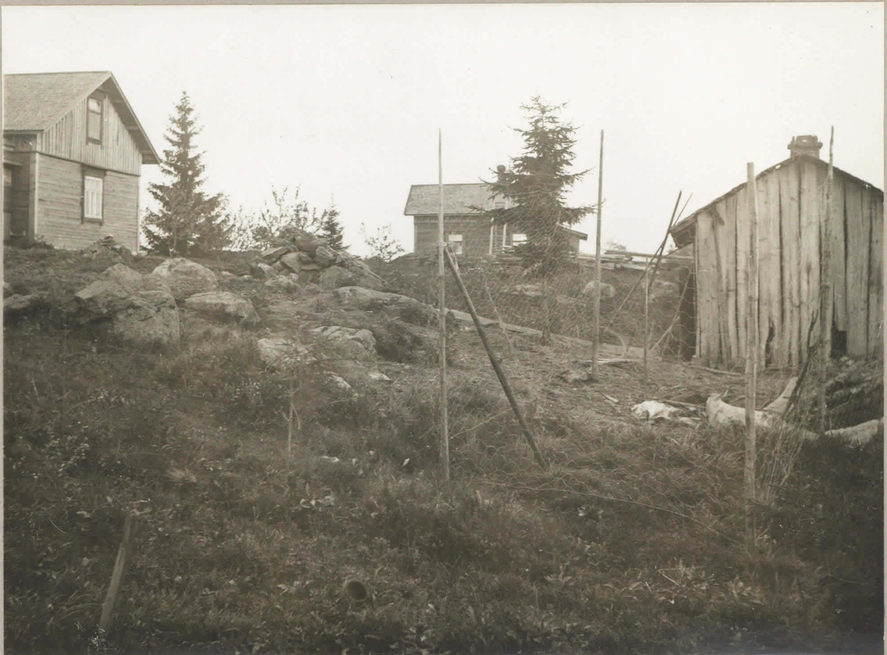
1. Mäkirinteen rautakautinen kalmisto (H. M. 9220). Taustassa Kirkojärvi ja kirkko.