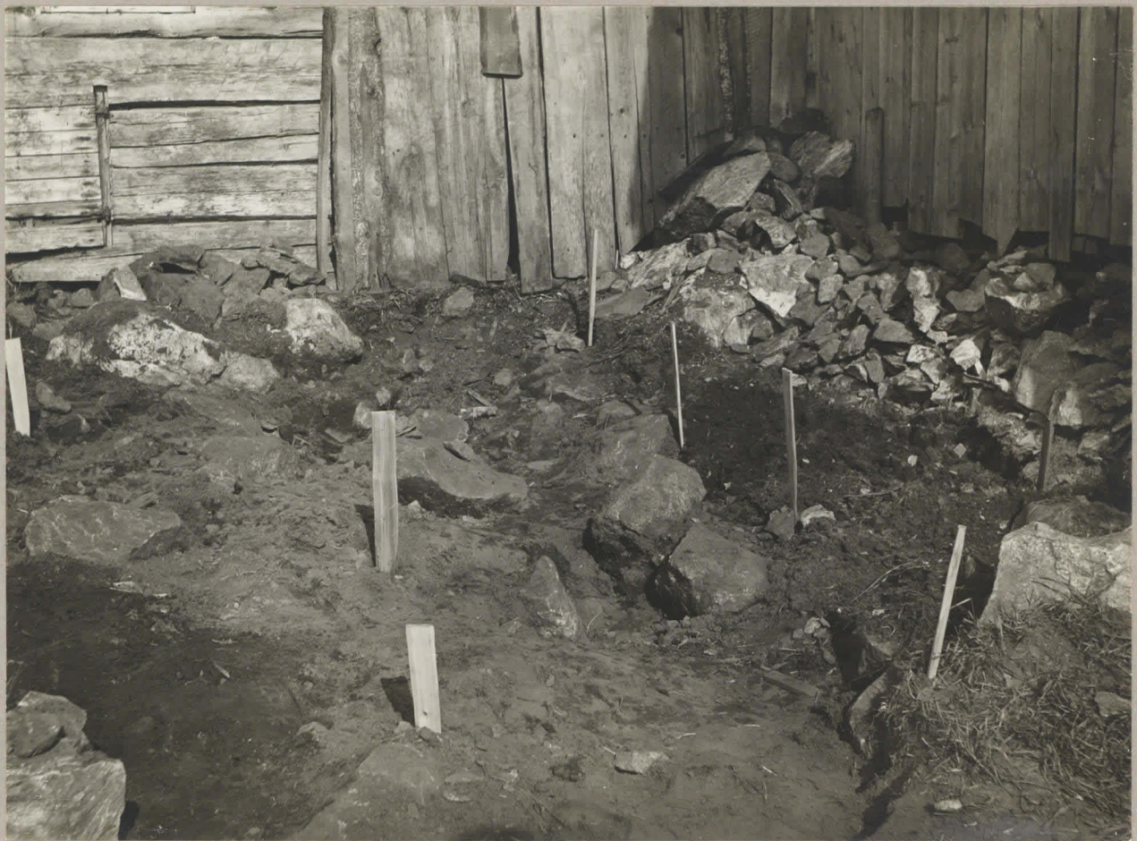
3. Kangasala. Mäkirinne. Kaivausalue I. H. M. 9220