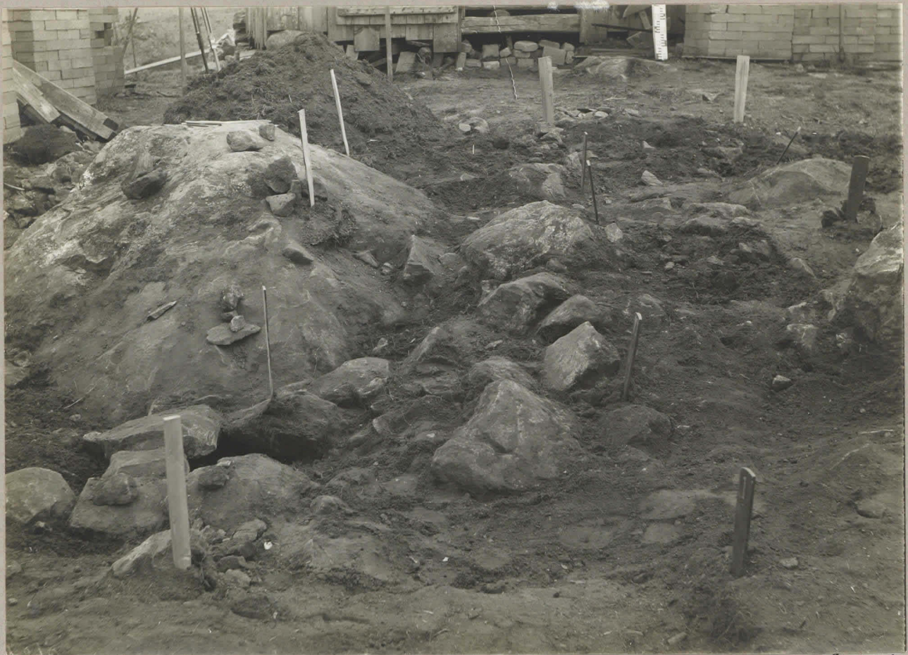
5. Kangasala. Mäkirinne. Kaivausalue II katsottuna O:sta. (H.M. 4220)