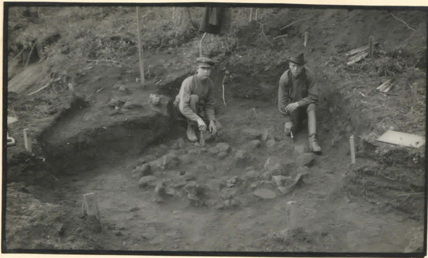
1. Kiveys rinduilla I-III: a-2, valokuvattu etelästä.