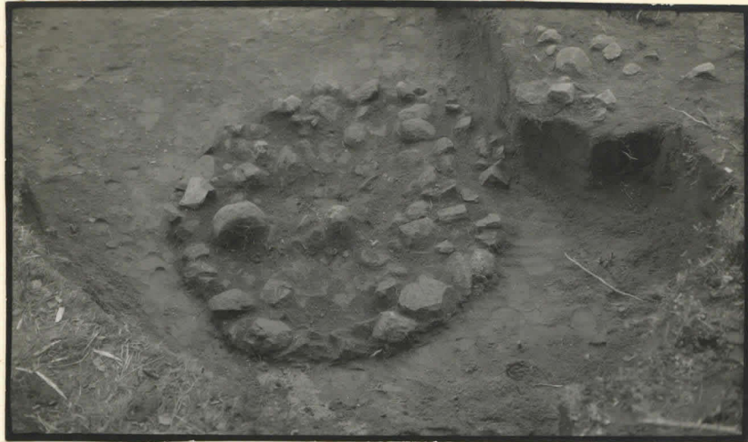
4. Kiveys I-III: a-2, länsilounaasta ylhäältä.