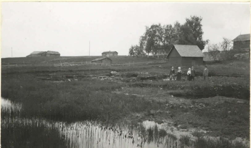
Tihala. Hylänjärven ranta, lev. 8623. paulusillain y. m. työpaikka.