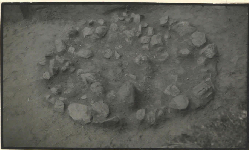
3. Kiveys I-III: a-2, länsiluoteesta, ylhäältä.