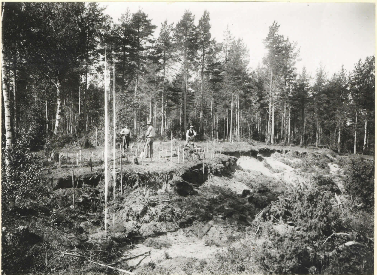
Tülitahdas I. kaiv. 1921.