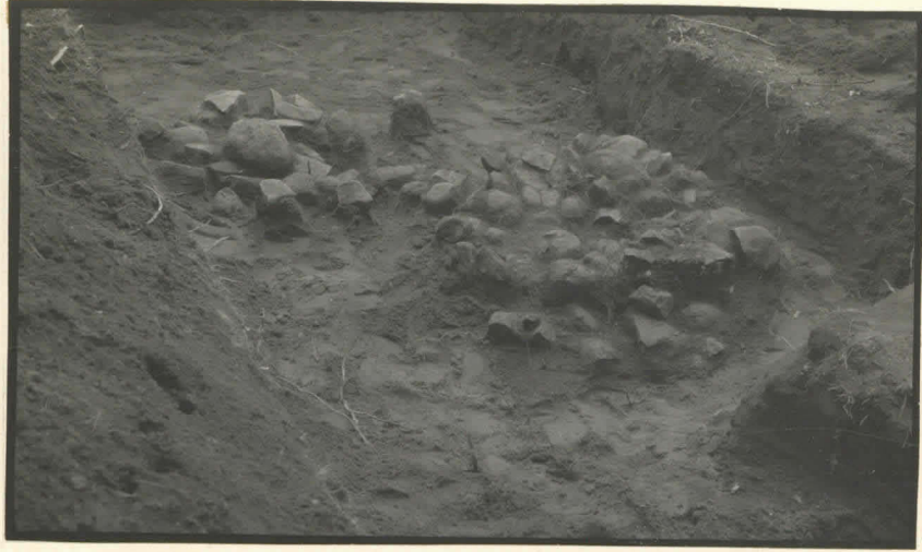
12. Kiveykset koillisesta.