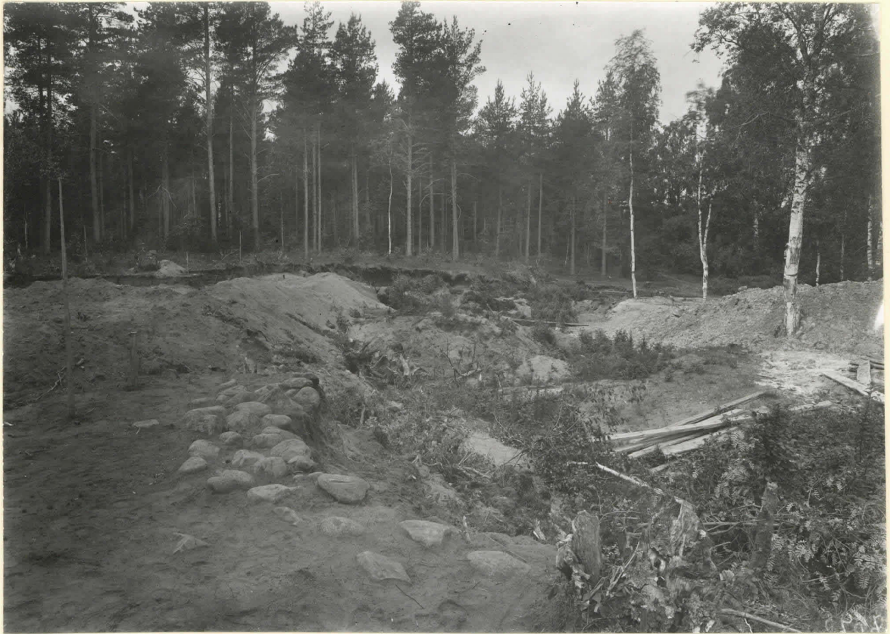
Tülitahdas III. kaiv. 1921. Fosfori idäntä. Lev. 8625