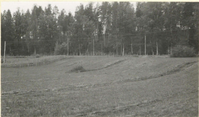
Kaivanta. Längelmäki - veden rautapöytä. Lev. 8622.