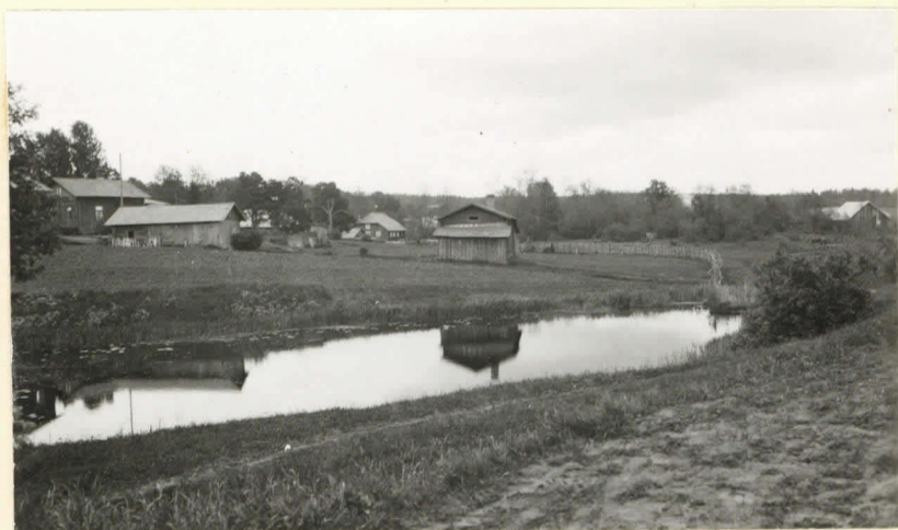
Huutijärvi, Sepänjärvi. luv. 8617.