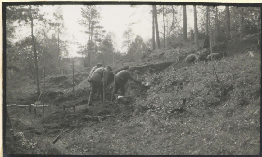
9. Kaiwaus länsiluoteesta.