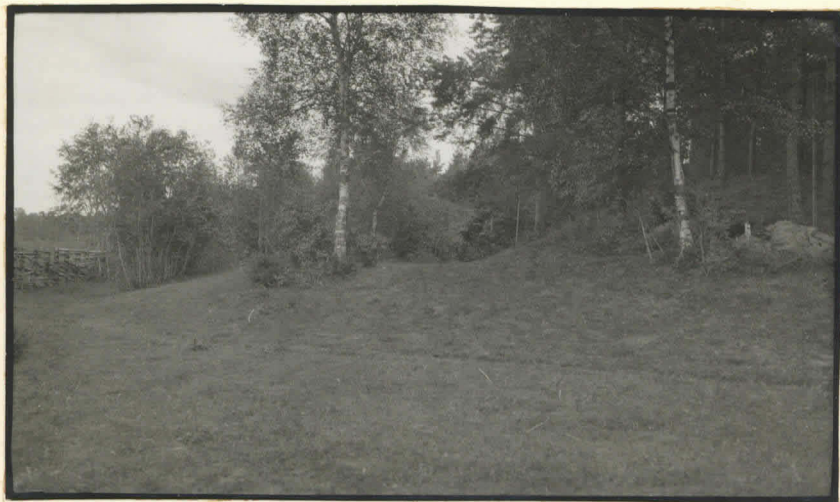
14. Kaivauskohdan alaosa lännestä.