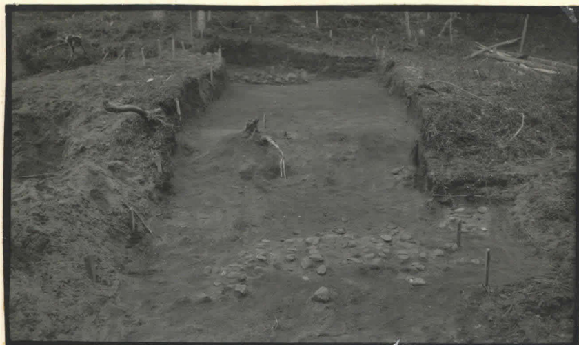
7. Kaiwaus pohjoisesta.