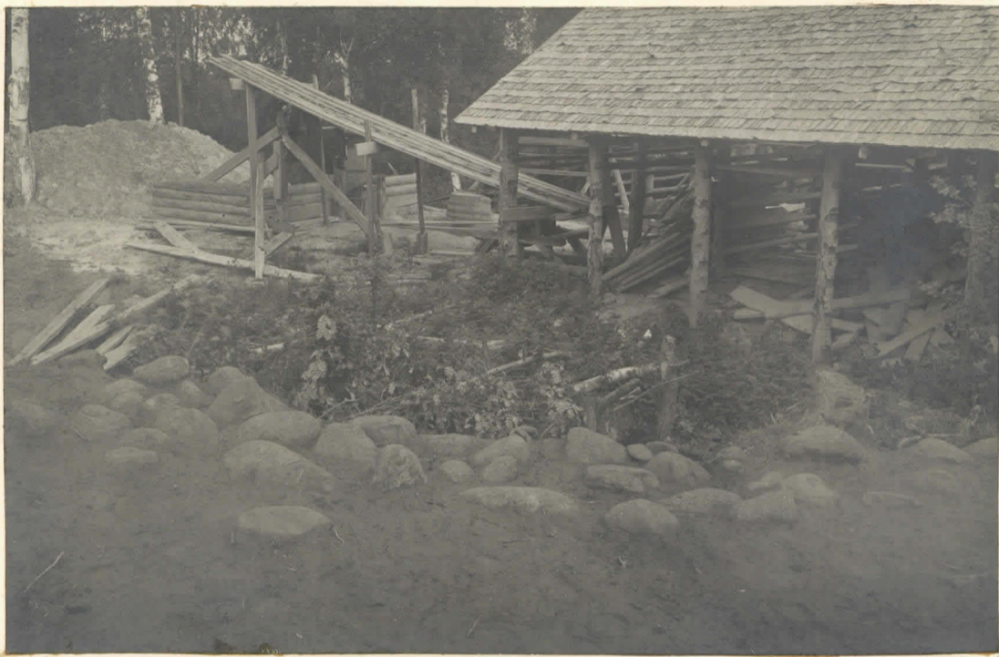
15. Iso kiveys kaakosta.