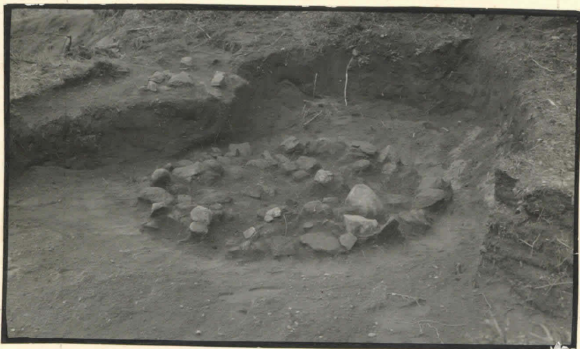
2. Kiveys I-III: a-2, luoteesta.