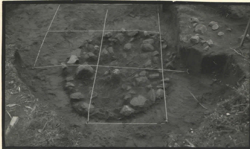
5. Kiveys I-III: a-2, etelästä, ylhäältä, nuorat osoittavat metriruudukusta.