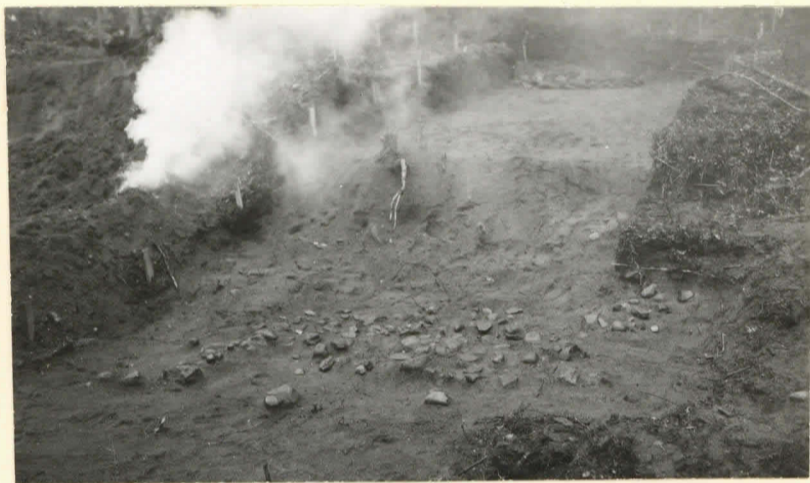
Sarsa, Pöhtön kair. polyni- luv. 8614. sista; vasemmalla säärkivaru. 1923.