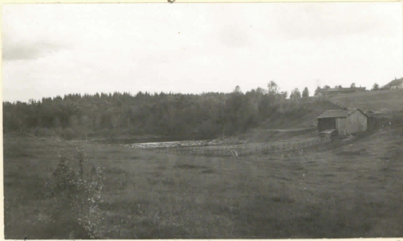
Huutijärvi, Lentolanjärvi. Lev. 8618.