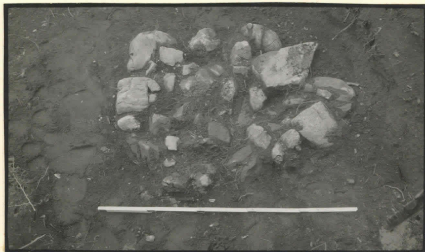
6. Kiveys koejassa pääkaivauksen länsipuolella, koillisesta ylhäältä.