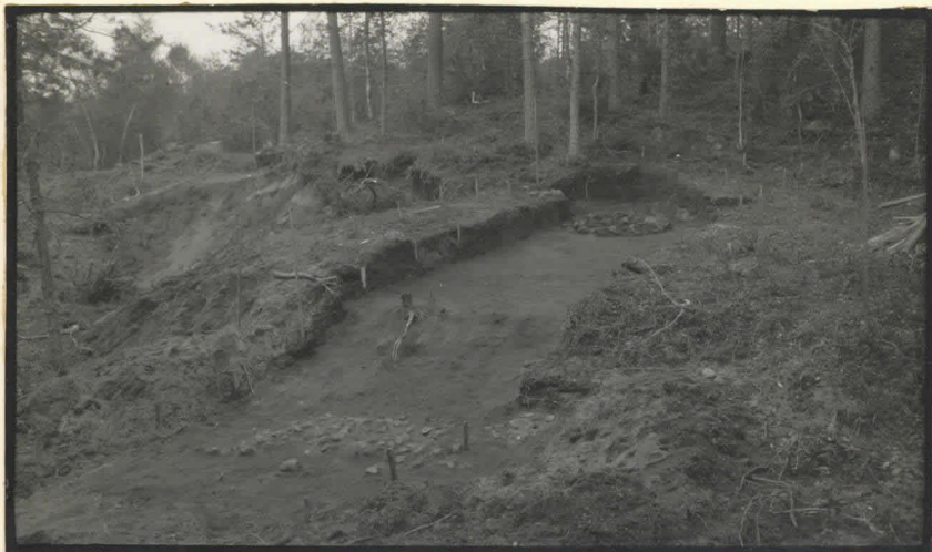
8. Kaiwaus luoteesta.