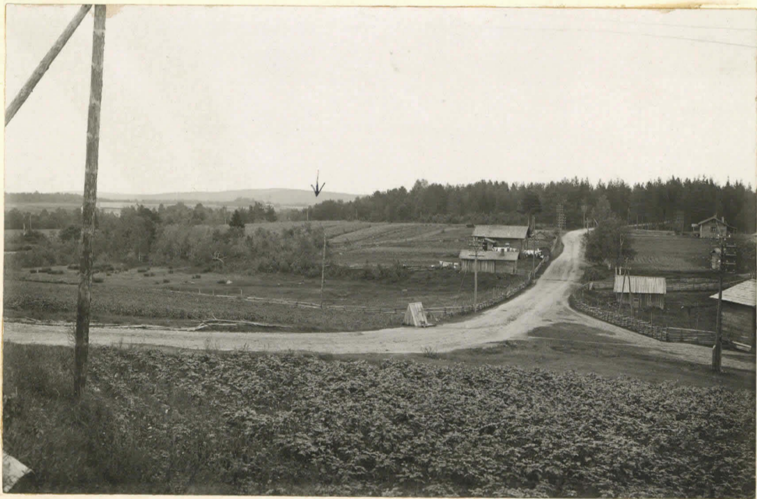
16. Sarsan uoma Huuti-järvellä. Nuolen koh- dalla Sepänjärven asuinpaikka. Valok. 1920.