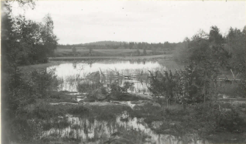
Sarsankosken niiska. Lev. 8621.