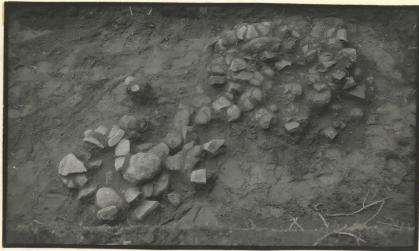
13. Kiveykset idästä, ylhäältä.