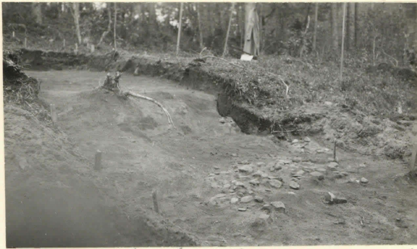
Sarsa, Pöhtön kaivaus luv. 8613. koillisesta. 1923.