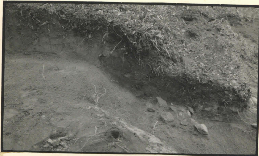
10. Leikkaus ruutujen IV:6,7 länsireunasta.