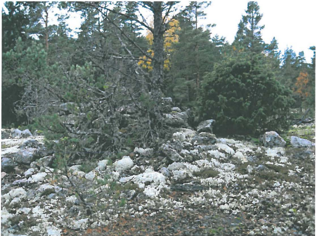
2. Kustavi, Sant Henrikinvuori. Viiden kylän yhteinen rajakivi. Kuvattu koillisesta. DT2009:32:9:004