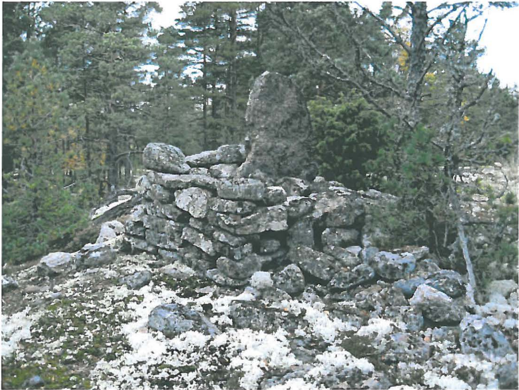
1. Kustavi, Sant Henrikinvuori. Viiden kylän yhteinen rajakivi. Kuvattu etelästä. DT2009:32:9:003