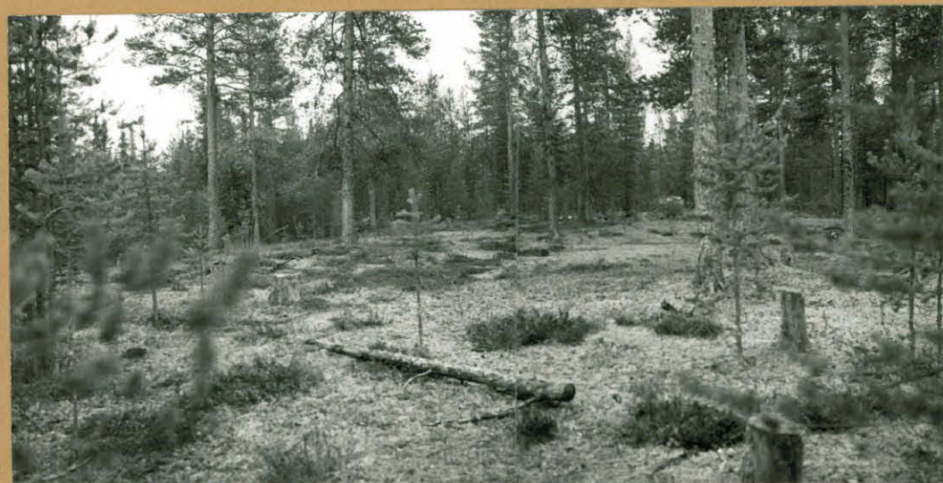
Kuva 2. f. 60789, 60790

3. Kivik. asuinpaikkaa hiekkakuopan etelä-kaakkoispäässä. kaakuneen puun juurakossa tuliraja ja runs. löytöjä, vahva kultt. krs. kuvattu etelälounaasta.