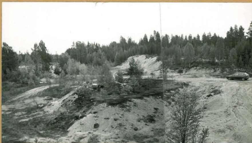
Kuva 1. f. 60787 - 60788

1. Yleiskuva hiekkakuopasta pohjoisluoteesta kuvattuna. Kivik. asuinpaikka hiekkakuopan reunoilla takana keskellä ja oikealla. Takana vasemmalla virtaa Kuivajoki.