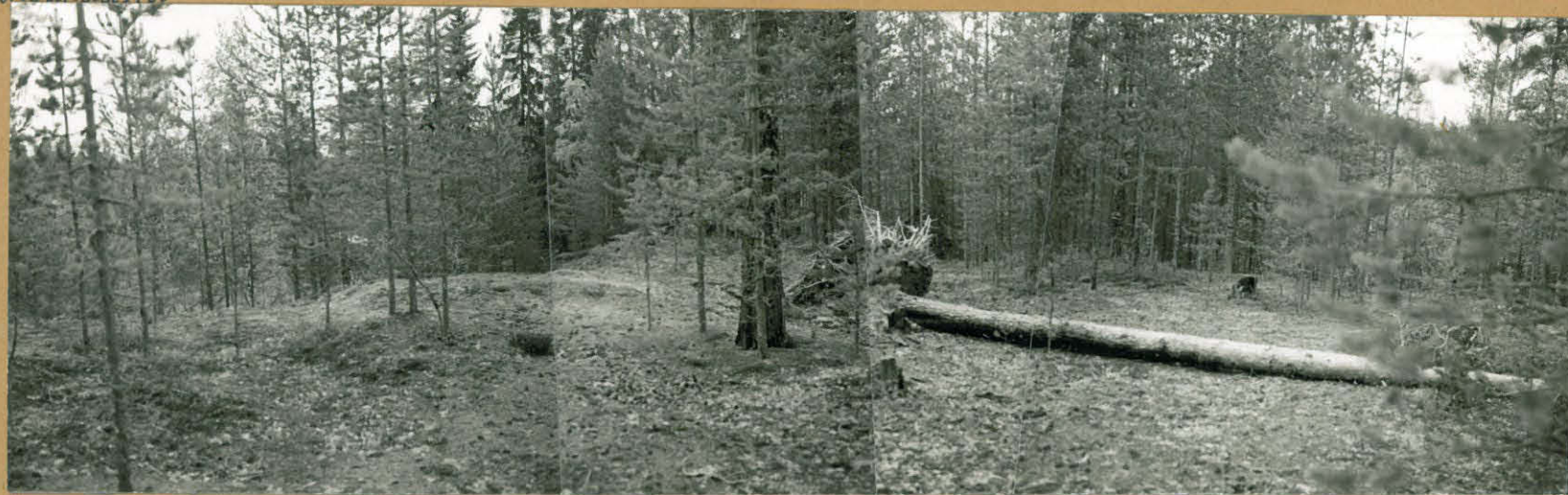
Kuva 3. f. 60792 - 60795

2. Kivik. asuinpaikkaa hiekkakuopan eteläpään ja metsätien välisessä maastossa. kuvattu kaakosta lounaaseen.