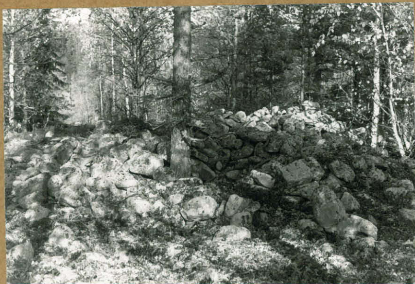
Kuva 1. Röykkiö alueen pohjoisosassa