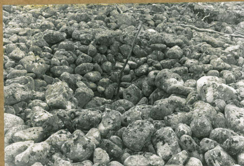
Kuva 4. Räkänkuoppa