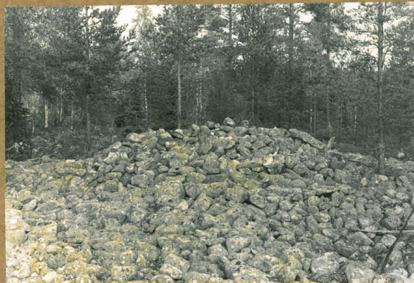
Kuva 2. Röykkiö