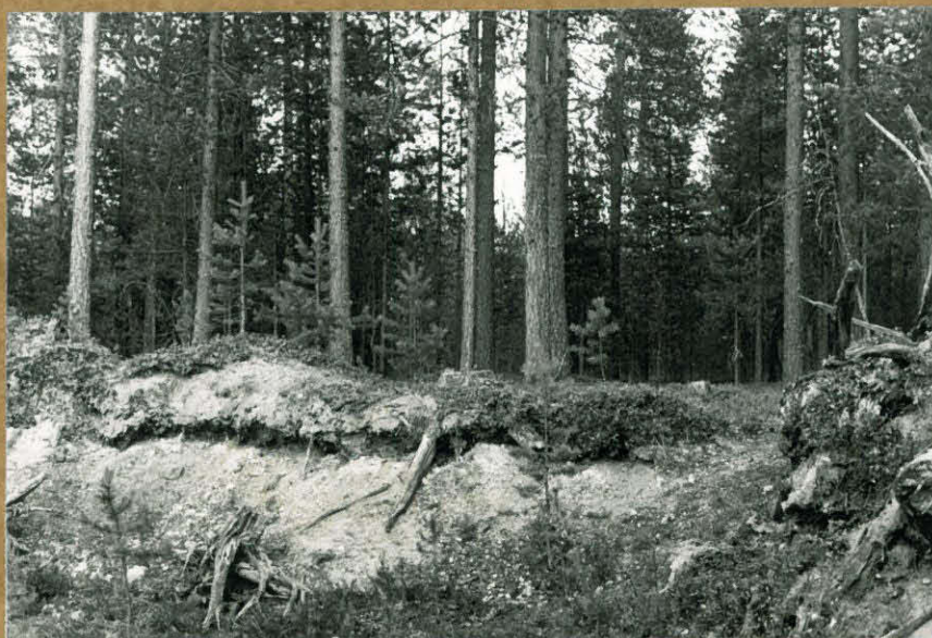
Yleiskuva. Hiekkakuopan eteläreunaa. NW-SE. F. 80895