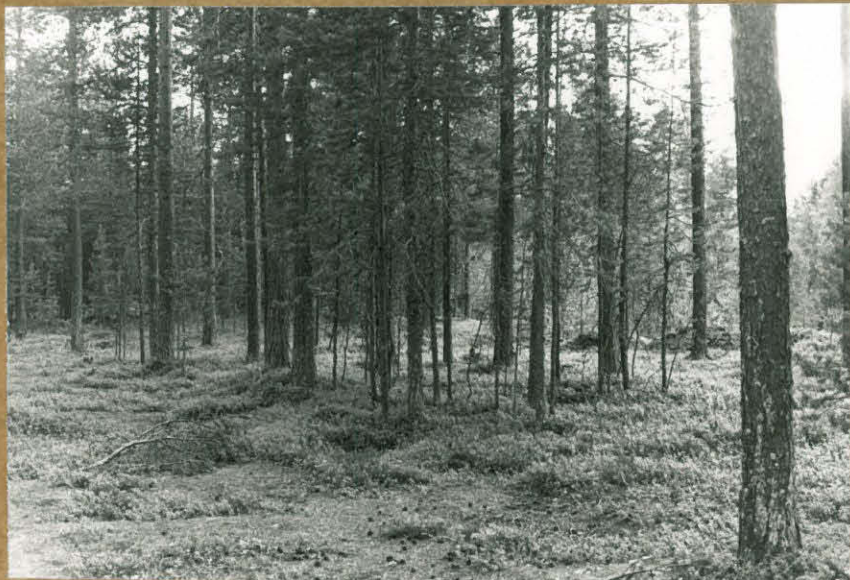
Yleiskuva. Asuinpaikan etjää osaa hiekkakuopan eteläpuolella. SE-NW. F. 80896