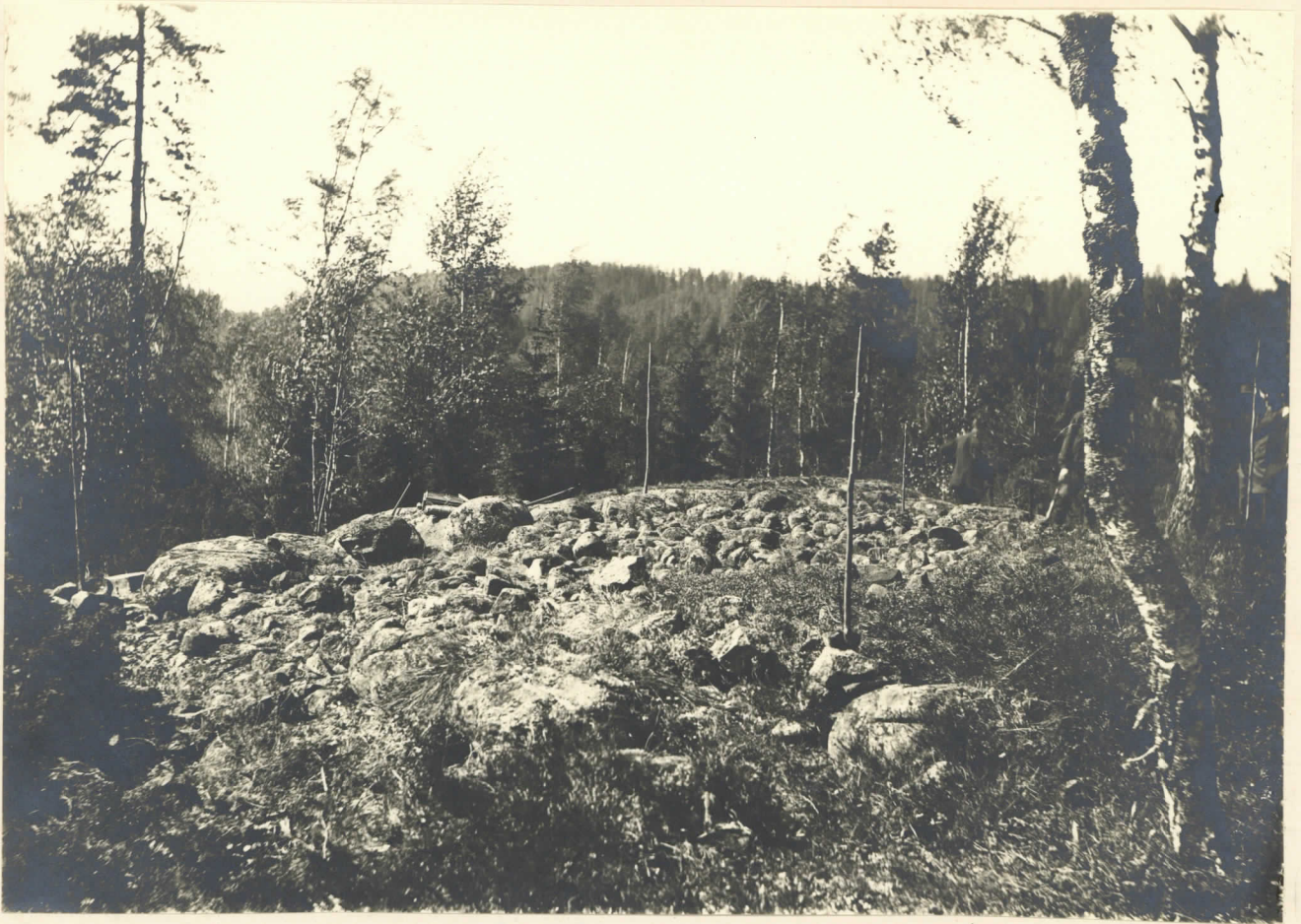
pl. 4769. Fyrkantigt stenkummel på Visalandskogen på Lövra hemmans mark, Manngårds by. Bilden är tagen från O.