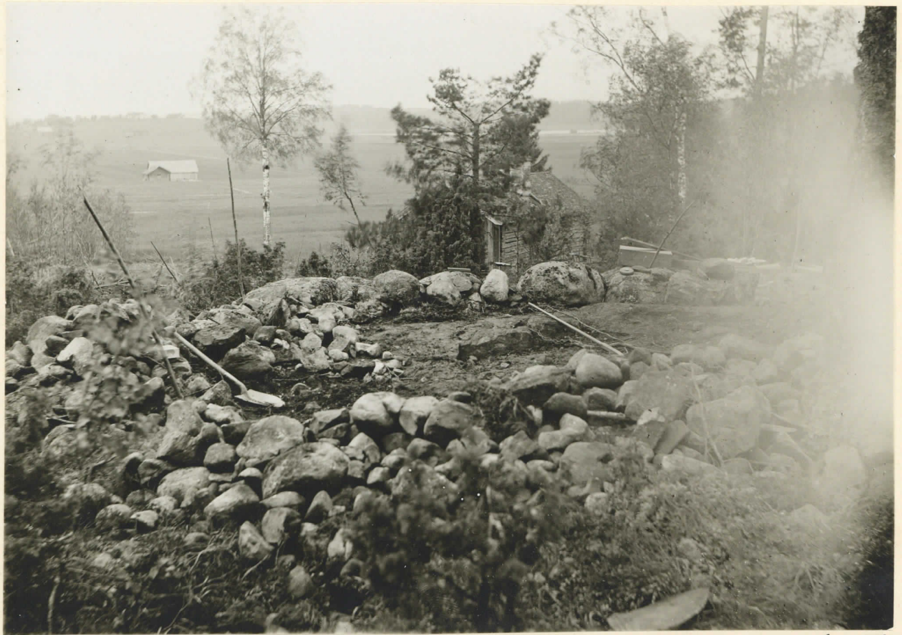
pl. 4770 Fyrkantigt stenkummel på Visalandskogen under pågåen- de undersökning. Bilden är tagen f. O. N. O.