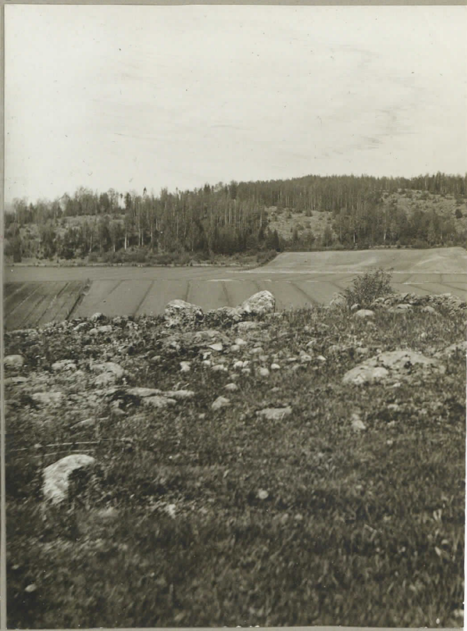
Utsikt från den västligaste gården i Mjölballstad i Karis socken åt norr. Till vänster Svartån. Vid d