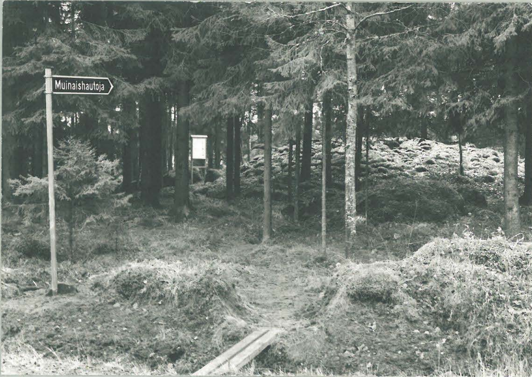
PELTONNAN ALATALON RÖYKELEIÖITÄ TIETÄÄ INFORMAATIO TAULU PAIKALLAAN KOKAK - 93