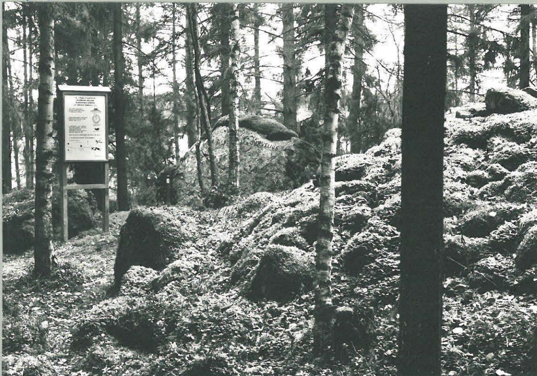
INFORMAATIO TAULU JA ASPELININ HAKENTAMA KIVI SEKÄ SUURIN RÖYKELEIÖ, NIST