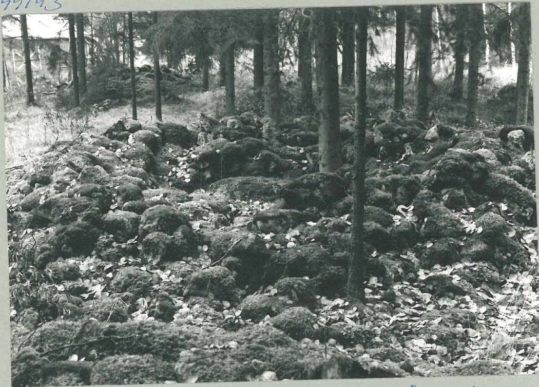
WARENIUKSEN 1849 KAIVAMA RÖYKKIÖ, JOSTA PROSSIVETSITSI Löytyi. JÄTETTY ENNALLISTANNAKSI, KUVA E:sta (A. LAUNAN)