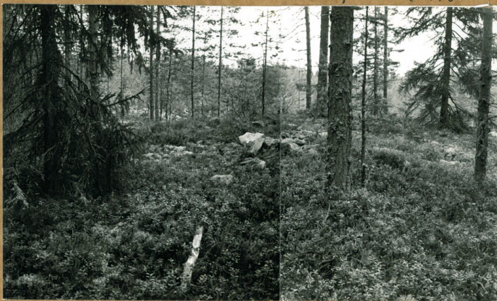
Kuopanteiden läntispuolella oleva suuri kivi-rainio, orstahin kaiveltu, taustalla vasemmalla häänötävät kuopanteiden alueet, kuv. itään