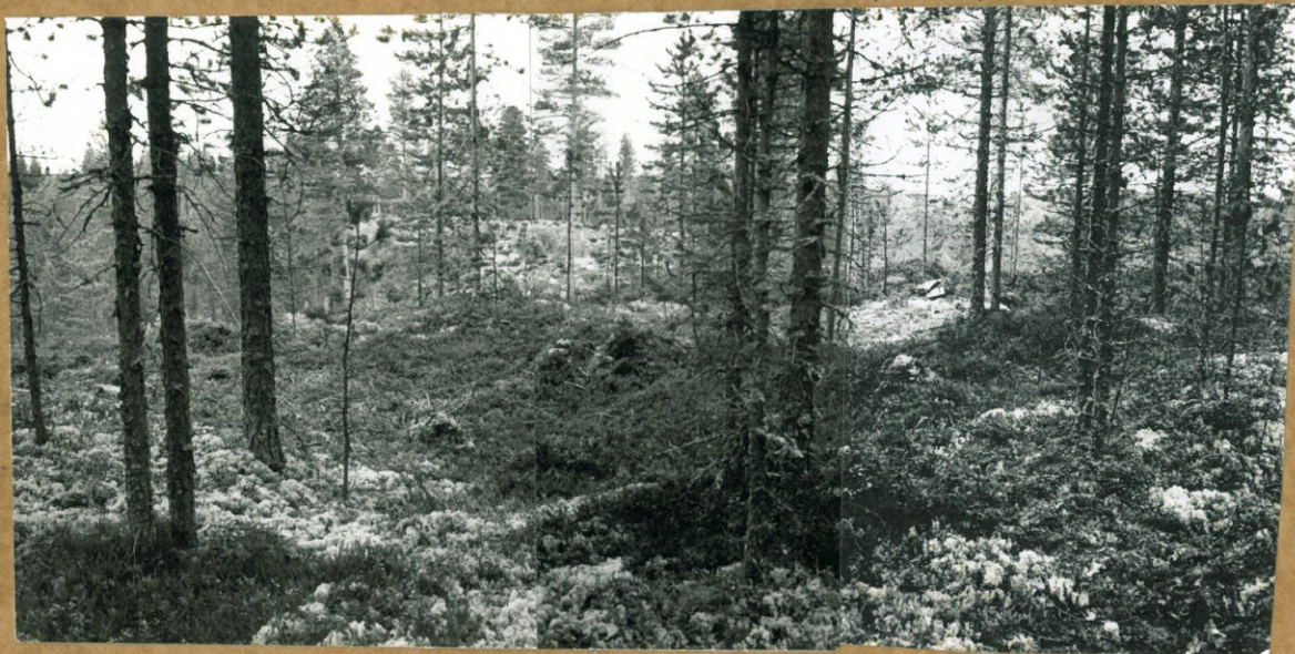
Pikkuharjun korkeimman kohdan kaakkoispuolella oleva karopantetta, taustalla metsäaurittua hakkuualueita, kuv. n. kohti etelää-lounasta