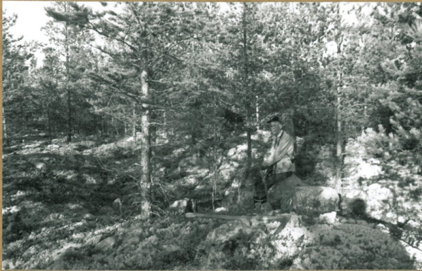
f. 105461. ASUINPAINANNE.