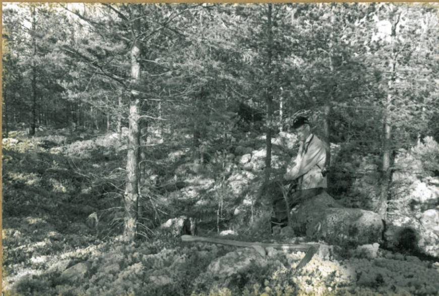
f. 105462. ASUINPAINANNE.