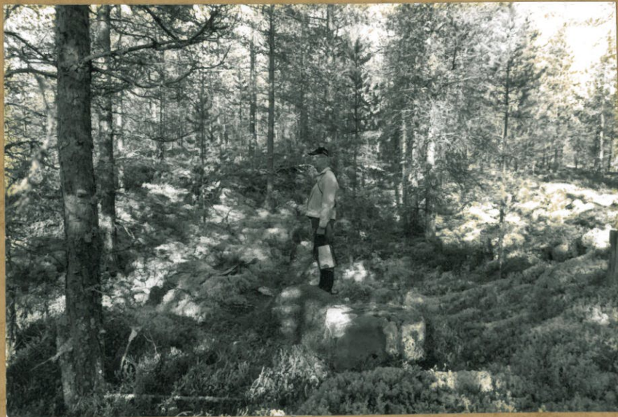
f. 105458. ASUINKUOPANNE. KUV. LÄNNESTÄ.