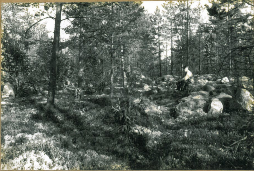
f. 105457. ASUINKUOPANTEEN EDUSTAA, JOSTA RAIVATTU POIS KIVIKKOA. KUV. LÄNNESTÄ.