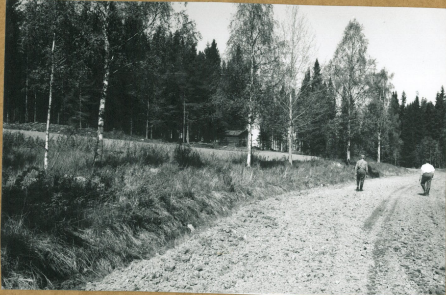
Kiviik. Asp. löytöjä TAUSTAN PELLOSTA, METSÄN REUNASTA, KUVA N. S:stä