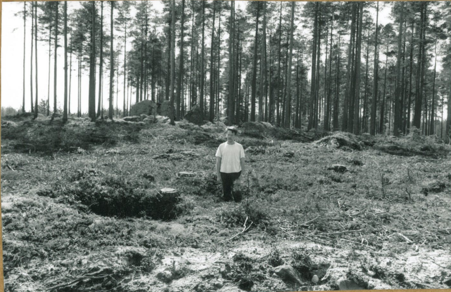
Kuopanteita harjanteen N-NE stuvlla, sorakuopan reunan läh. kuopassa setso mukka komposti- nen ullavilla.