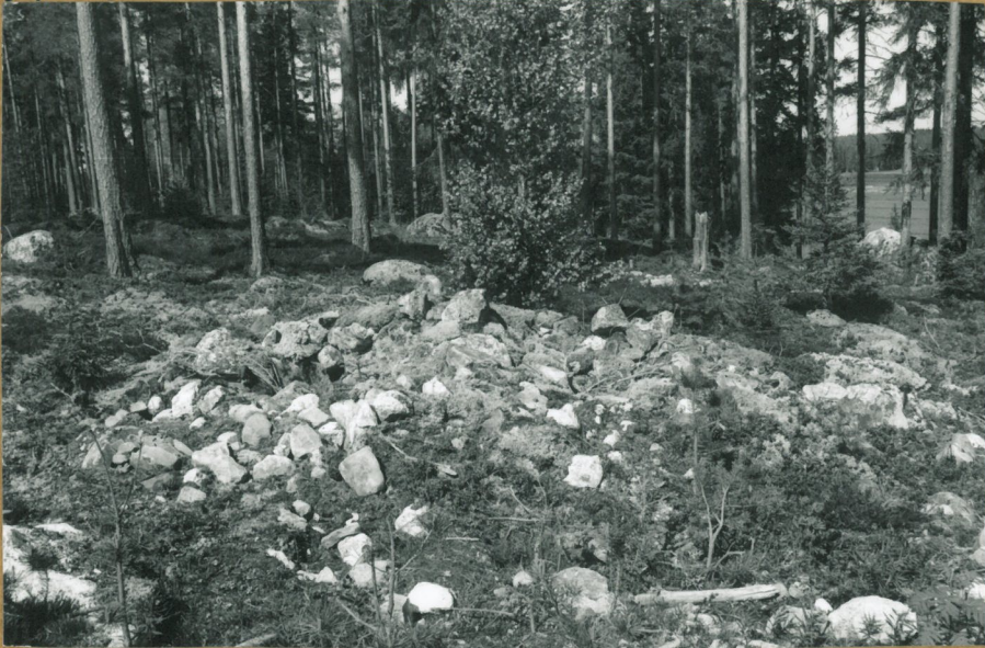
Röykkiä, sorakuopan pohj. reunan lähekkä, kuva S:stä