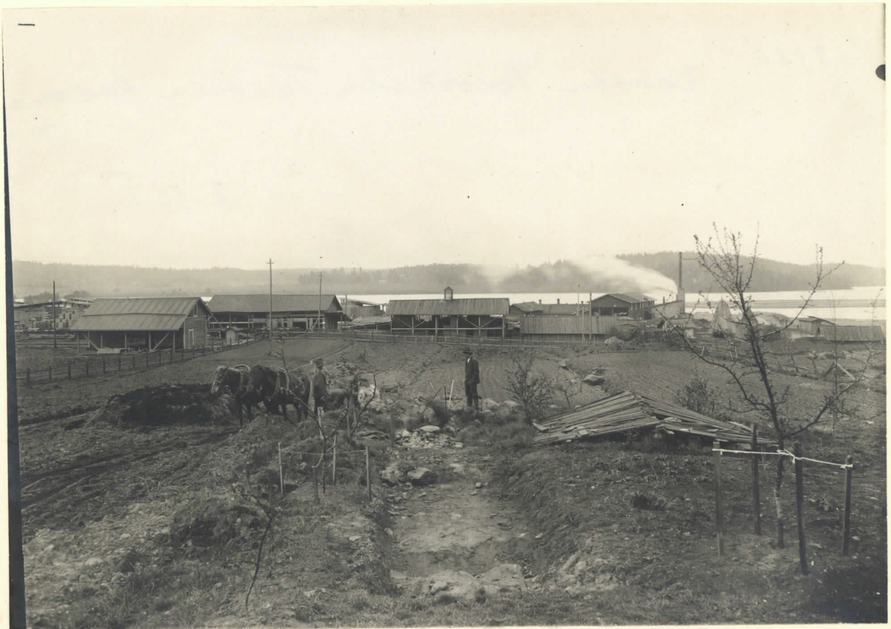
Karkku, Patrialan Tulosten kalmisto