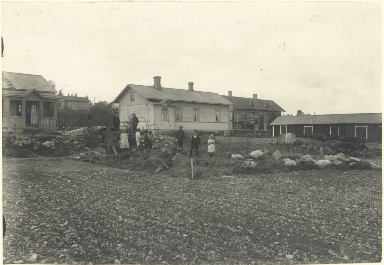
Karkku, Patrialan Tulosten kalmisto.