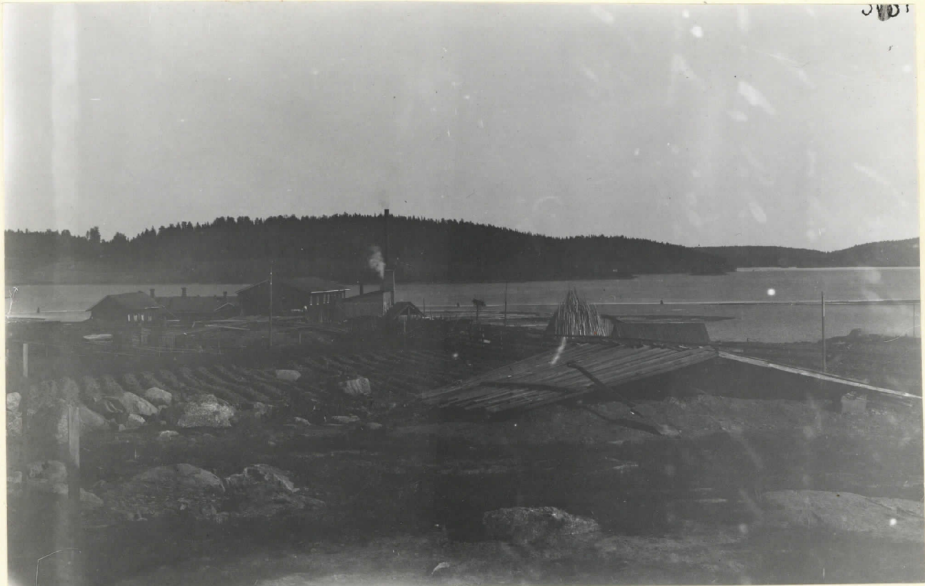
Tulosen kaluisto (etualalla) Tammiiston lev. 3031. Pilalla. Tuohi-A. H:n kesäk. 1909.