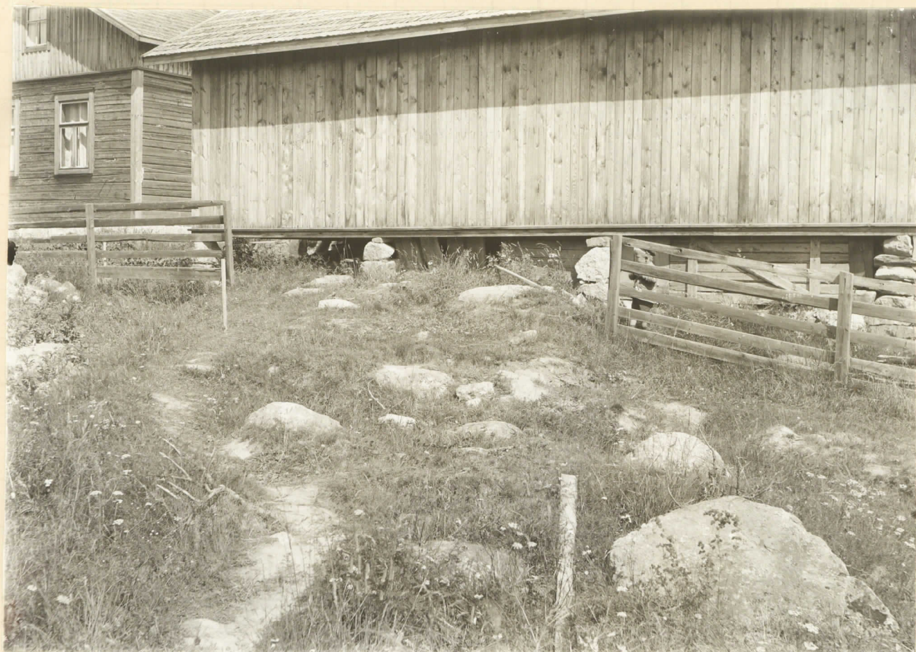
3. En del af samme græffält: området W om Tuloneus uthus. Till vänster Tuloneus stuga.