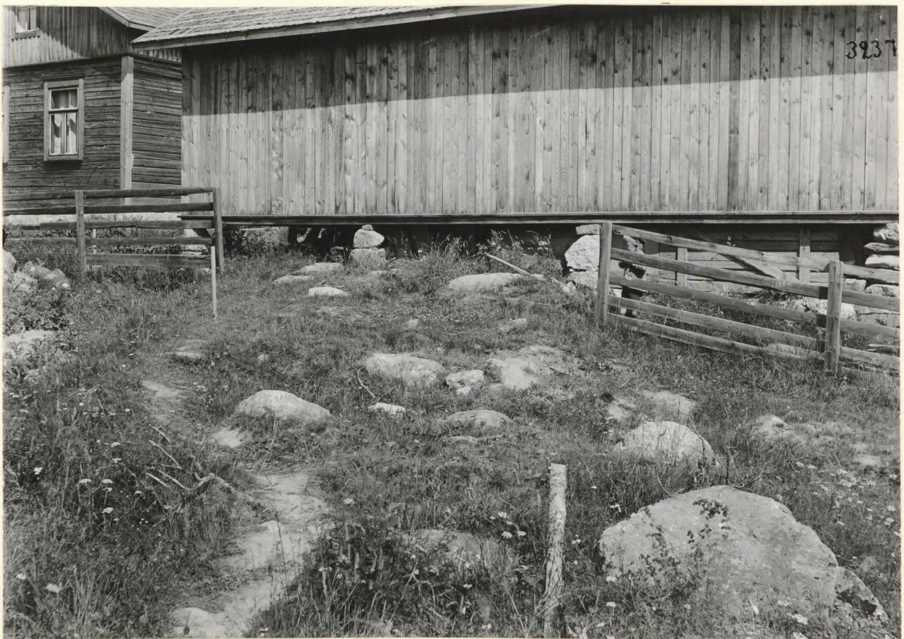
Tuloksen ulkokuonerivin takana oleva alue lev. 3237. kaluistoa; tutk. 1911.