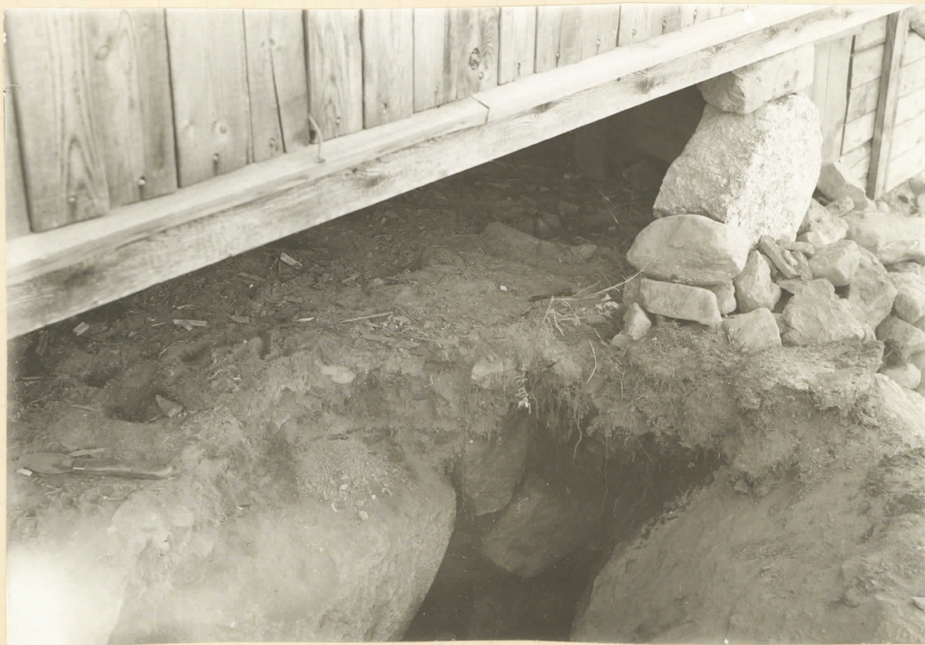
4. En del af samme græffält: rutan B 10.