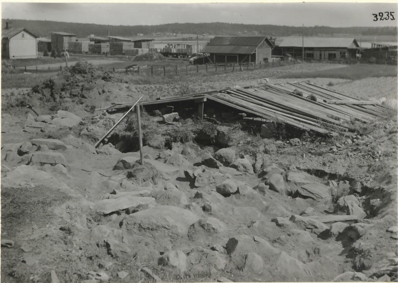
Tulosen kaluisto. 1911.