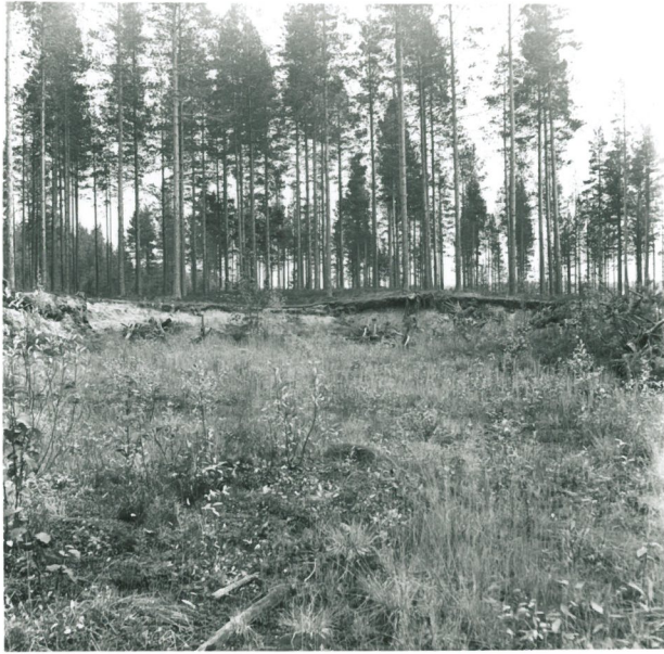
VÄLITALONKANKAAN KIVIKAUTISTA ASUIN- PAIKKAA KUVATTU- NA POHJOISESTA.