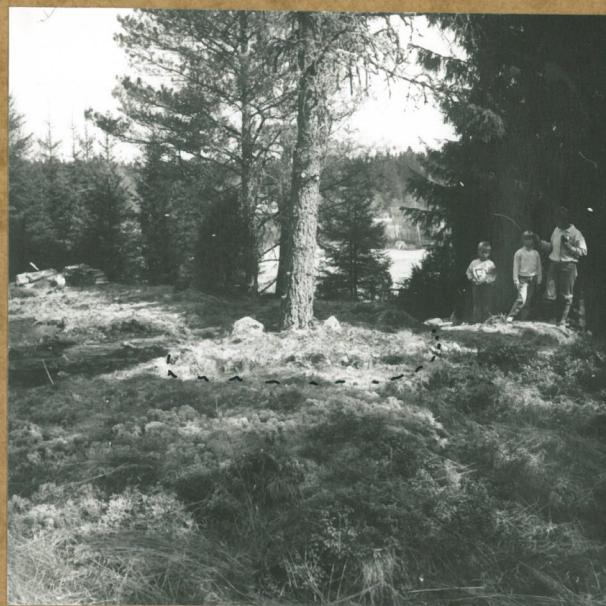
neg. 75945 Etualalla puun juurella röykkiö. Taustalla peltojen takana Köyliönjoki: SW.