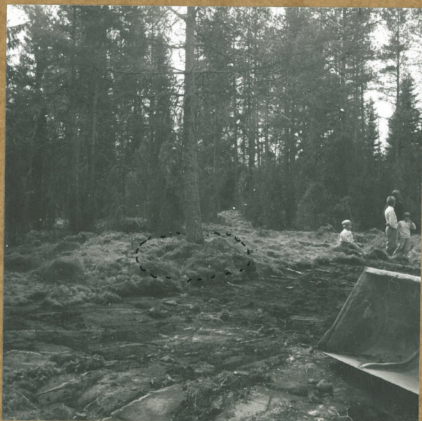
neg. 75946 Etualalla kuorittua aluetta, jalle tulee rakennus. Kuvan keskellä" röykkiö puun juurella. N.