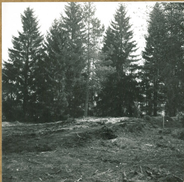
neg. 75943 Matala kiveys kuvan keskellä olevan männyn juurella. W.