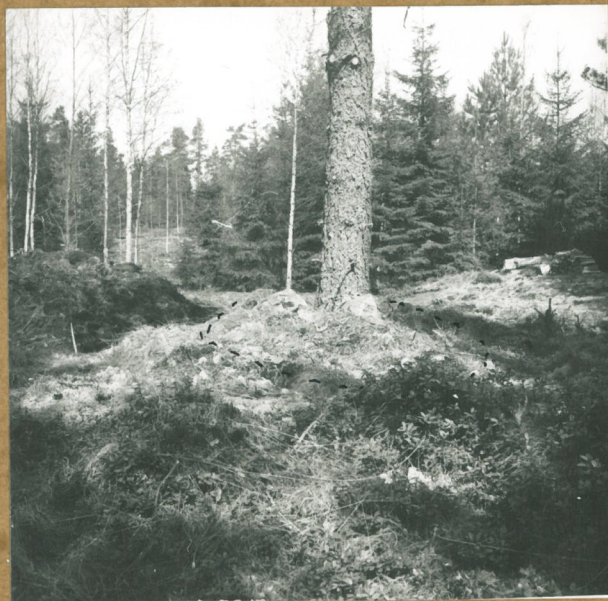
neg. 75944 Jätkälän alta pisti röykkiöstä esiin muutamia isompia kiviä". SE.