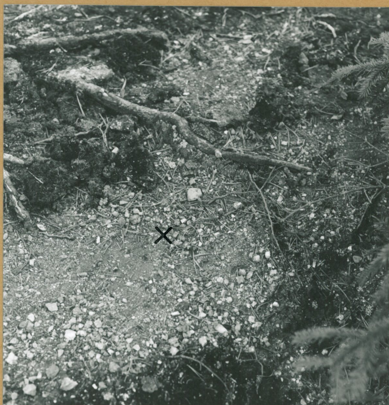
Kuva 2. Löytöpaikka merkitty ruk- silla. Kuva lounaasta.