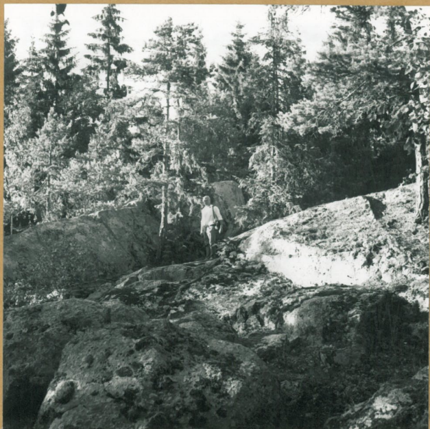
Kuva 1. J. Saukkonen seisoo saviastian- palan KM 2322I:n löytöpaikalla. Kuva etelästä.