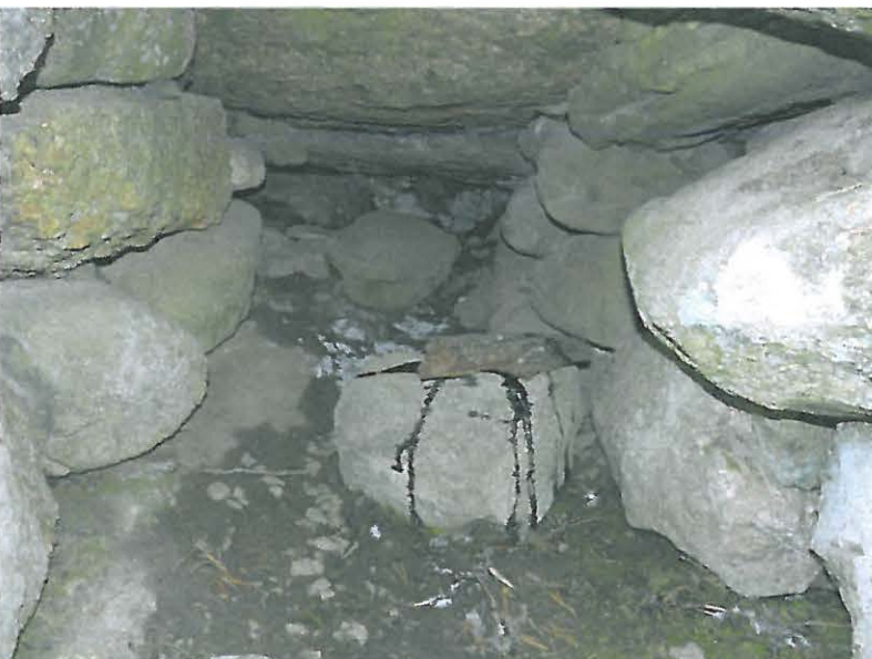
Kuva sisäosasta. Etummaisella kivellä tervaa, jota maanomistaja oli tuonut paikalle tarkoituksenaan elävöittää sen hajulla tervamiiluksi käsittämäänsä rakennelmaa.