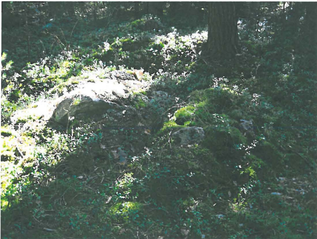
2. Laitila, Summamutikka. Kiviröykkiö Olli ja Aapo Jaatisen välissä. DT2009:32:12:kuva 122