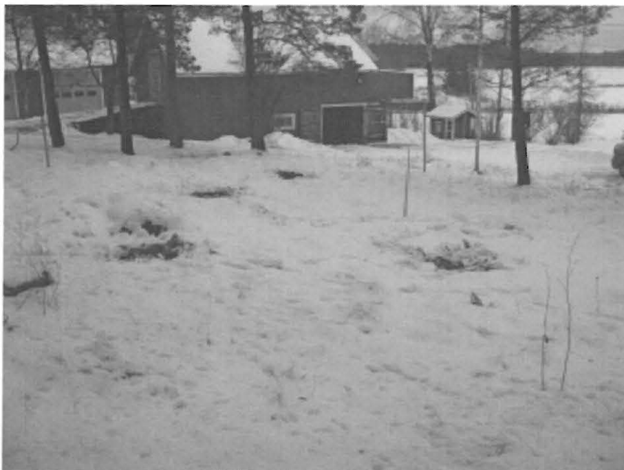
3. Laitila Krupinmäki. Rakennuspaikka kuvattuna luoteesta kohti tilan kaakkoisreunan ulkorakennusta. DT2008:60:3:3