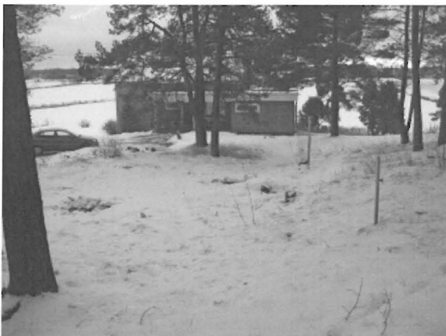
4. Laitila Krupinmäki. Rakennuspaikka kuvattuna pohjoisesta kohti vanhaa asuinrakennusta. DT2008:60:3:4/Heljä Brusila