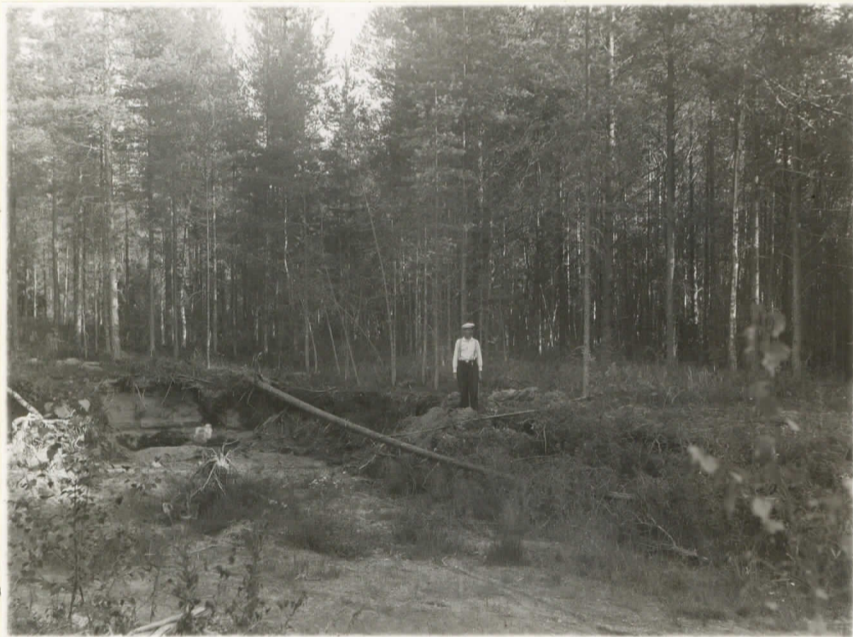
Valok. 11822. J. Leppäaho - 37. Kuva kuin yllä, mutta lähem- pästä otettuna, suunta kaakko.