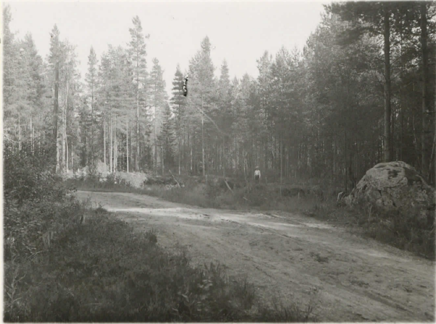
Valok. 11821 J. Leppäaho - 37. Kerimäki, Runkaniemi (Rannaniemi) Talollisten Veikka, Toivo ja Sulo Ker- jäläisen hiekkakoppa. Kamprakasa- misten saviasiunpalain 10484 löytöpaikka. X=10632. Suunta kutaakin- hin itä-haakka. Oikealla kpr. hivi.