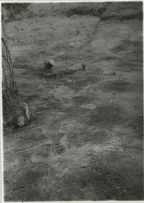
I karttataso III: 5, 6 lähellä