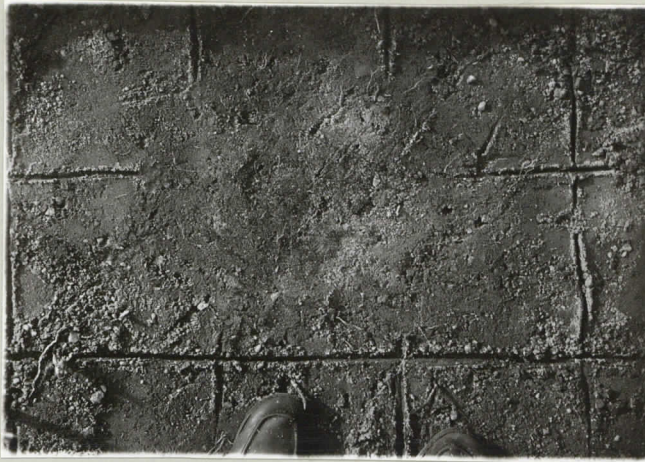
Purupihkan löytökohda I, II: 2