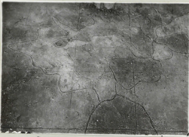
I karttataso III: 5, 6, idässä