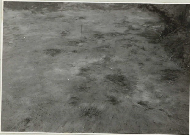
II karttataso III: 4, 5, lähellä