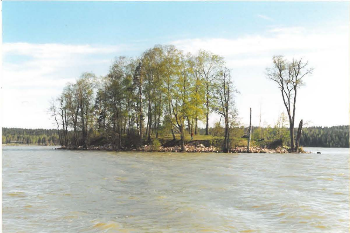
KUVA1. YLEISKUVA STORHOLMENISTA. KUVA OTETTU KOHTI KOILLISTA. SIVILIPALVELUS- MIES MIKKO CAATELL SEISOO RANTA PENKEREELLÄ KOKONAISEN ASTIAN LÖYTÖPAI- KALLA.