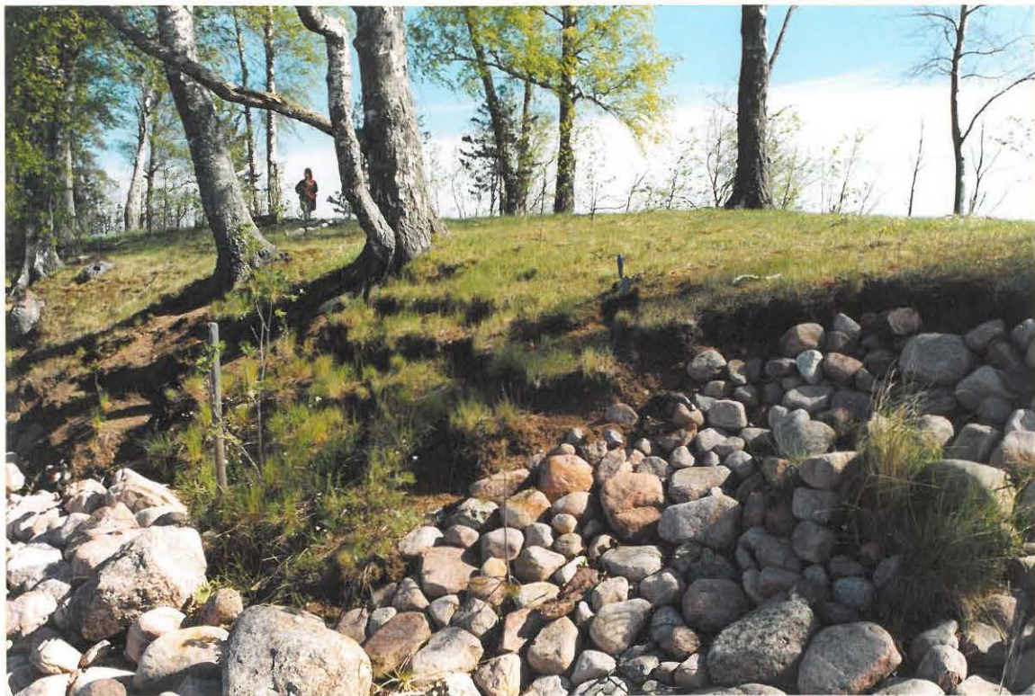
KUVA2. KOKONAISEN ASTIAN LÖYTÖPAIKKA KUVAN KESKELLÄ KAIVAUSSLASTAN KOHDALLA. ETUALALLA TUOTUA RANTAKIVIKKOA JA KIVETTYÄ RANTAPENGGERTÄ.