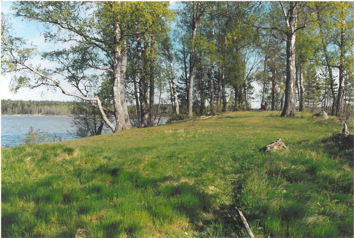
KUVA 3. STORHOLMENIN ETELÄPÄÄN MAHDOLLISESTI TASATTUA ALUETTA. ASTIAN LÖYTÖPAIKKA KUVAN VASEMMASSA REUNASSA. KUVA ON OTETTU AIVAN SAAREN ETELÄPÄÄSTÄ KOHTI NNW.