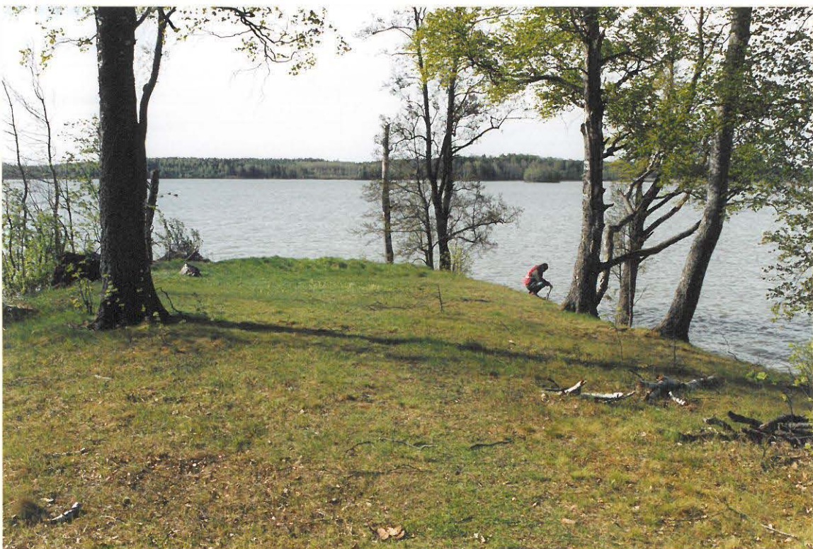
KUVA 4. STORHOLMENIN ETELÄPÄÄ. SAAREN KIVIKKOISIN KOHTA ON KUVAN VASEMMASSA REUNASSA KOIVUN TAKANA. MIKKO CANTELL KYRKISTELEEE ASTIAN LÖYTÖPAIKALLA.