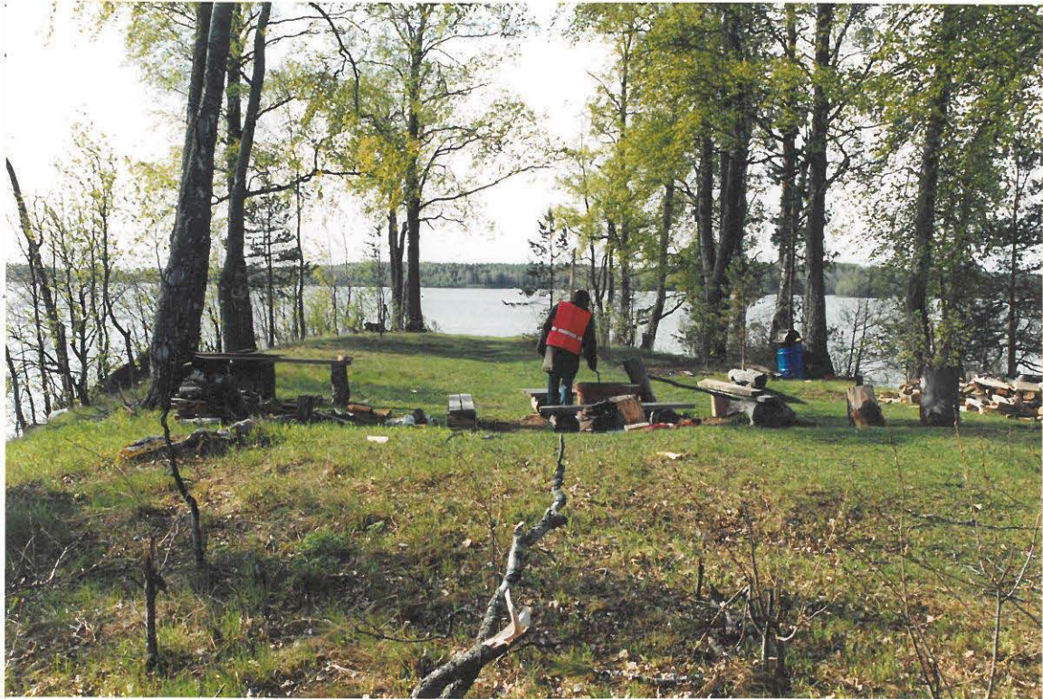
KUVA 5. STORHOLMENIN KESKELLÄ OLEVA TASATTU HIEMAN YMPÄRISTÖÄ MATALAMPI ALUE. KUVA ON OTTU KOTI ETELÄÄ SAAREN KORKEIMMALTA KOHDALTA TASATUN ALVEEN POHJOISPUOLELTA. ETUALALLA GRILLIPAIKKA.