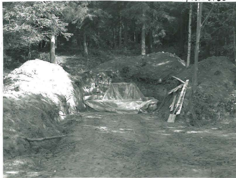
KUVA 3: KELLARINKUOPPA. MAA ON KIVISTÄ HIESPÄMITÄÄN MUINAISNÖKSEEN VIITTAVAA EI NÄKYVÄ.