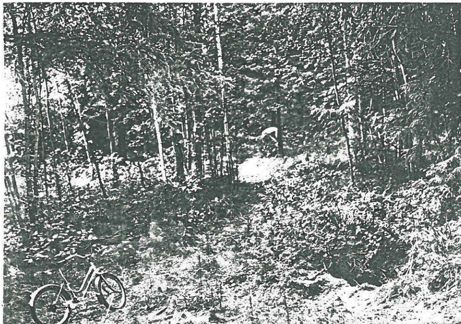
KUVA 1: KERAMIikka (KM 25714) LÖYTYY EDESSÄ KESKELLÄ NÄKYVÄSTÄ KUOPASTA. KELLARIN PAIKKA, KAUEMPANA NÄKYVÄN AORISSASEN KOHDALLA. KUVATTU KAAKOSTA.